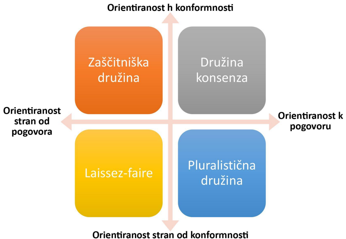
Slika 2.1: Tipologija komunikacijskih vzorcev