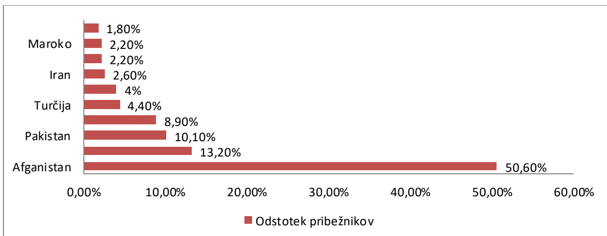
Graf 5.3: Prikaz % prosilcev za mednarodno zaščito v Sloveniji po državah izvora (od januarja 2017 do julija 2017)

V Sloveniji je do junija 2017 prebivalo 451 oseb s statusom mednarodne zaščite ter 257 prosilcev za mednarodno zaščito (Vlada RS, 2017). Jazbec (osebni intervju, 2017, 21. september) 4 o prihodu oseb z mednarodno zaščito dodaja, da je oseb »vedno več v Sloveniji, številka se povečuje tudi s pričo tega, da je država sprejela in sprejema ljudi z relokacijske sheme /.../Ampak poleg te relokacijske sheme še vedno prihajajo tudi drugi ljudje po redni poti v Slovenijo«. Največ prosilcev za mednarodno zaščito prihaja iz Afganistana, sledijo Sirijci, Pakistanci in Alžirci (glej Graf 5.3).