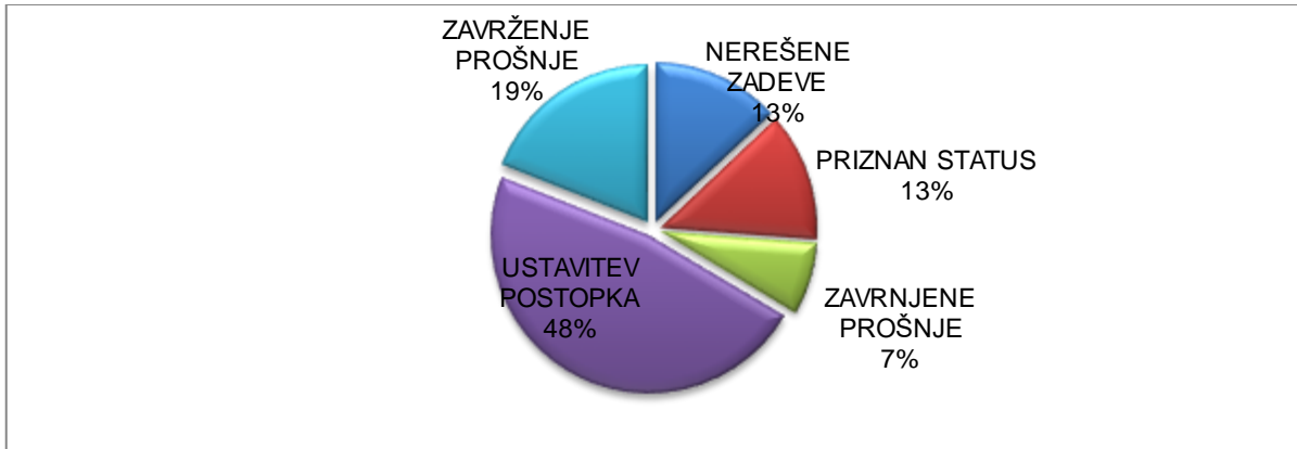
Graf 5.2: Statistika priznanih in zavrnjenih prošelj za mednarodno zaščito v Republiki Sloveniji za leto 2016