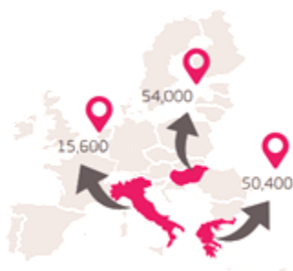
Slika 5.1: Prikaz relokacijske sheme Evropske unije

Dejstvo je, da so v zadnjih letih največ pribežnikov sprejele Grčija, Italija in Madžarska, zato je Evropska unija leta 2015 sprejela odločitev, da bo premestila in preselila osebe, ki potrebujejo mednarodno zaščito na podlagi delitve bremen med državami članicami EU (glej Slika 5.1). EU se je s članicami zato sporazumno odločila, da bo premestila 160000 in preselila 20000 oseb, k razporeditvi pribežnikov se je zavzela in vključila tudi Slovenija. (Evropska komisija, 2017; Ministrstvo za notranje zadeve, 2017d).