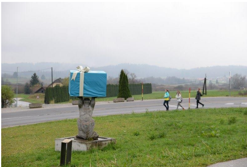
Slika C.9: Kip z darilom