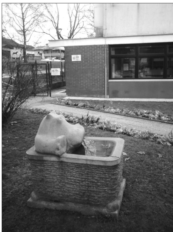
Slika C.11: Kipa pred vrtcem Kekec in vrtcem Pastirček