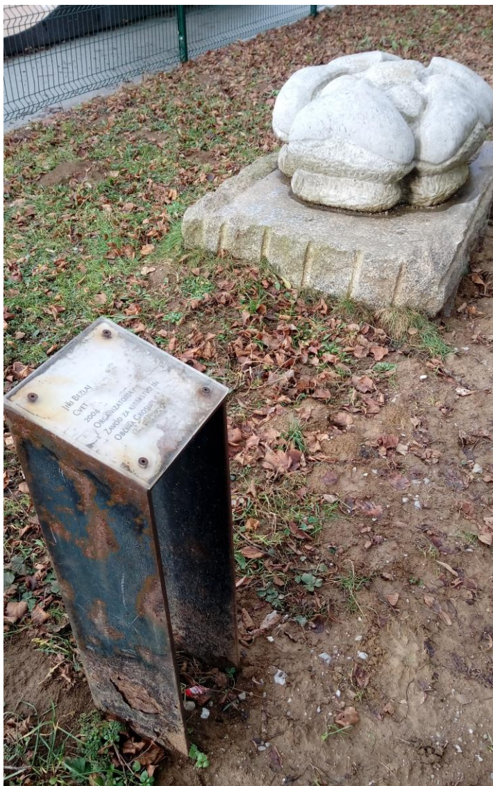
Slika C.3: Kip rože, ki naj bi bil po prvotnem načrtu postavljen v reki Grosupeljščici