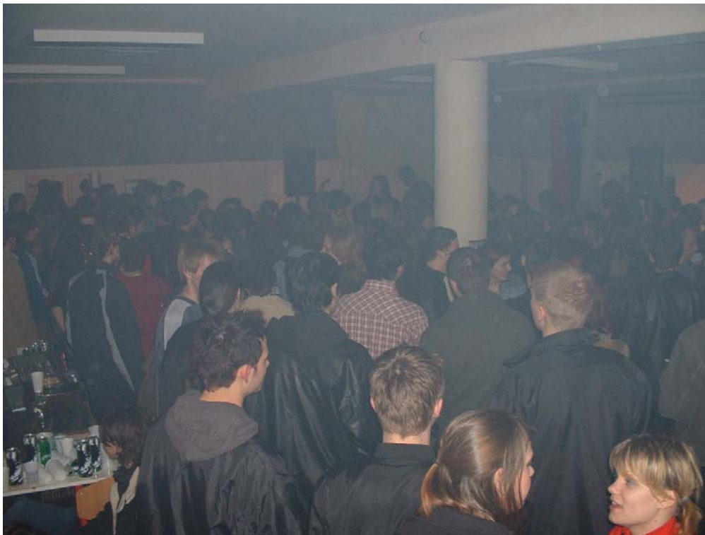
Vir: zasebni arhiv (2003)

Marca 2003 v Sloveniji poteka referendum o vstopu Slovenije v NATO. Razočarani nad sramotno servilnostjo slovenske politične elite hegemonom svetovne politike in orožarskih poslov ter nepotrebnim širjenjem strahu med prebivalstvom v Ambasadi organizirajo dvojni sklop koncertnih prireditev »ANTI-NATO«. Tam igrajo podobno družbeno-kritično razmišljujoči alter bendi, med premori pa je na voljo tudi odprti mikrofoni za vse obiskovalce, ki želijo izraziti svoje mnenje ali komentar. V ognjenih zubljih in poteptana se med občinstvom znajde tudi replika ameriške zastave. Radikalna politično deklarativna poteza v lokalnem okolju znova vzbudi precejšen nemir.