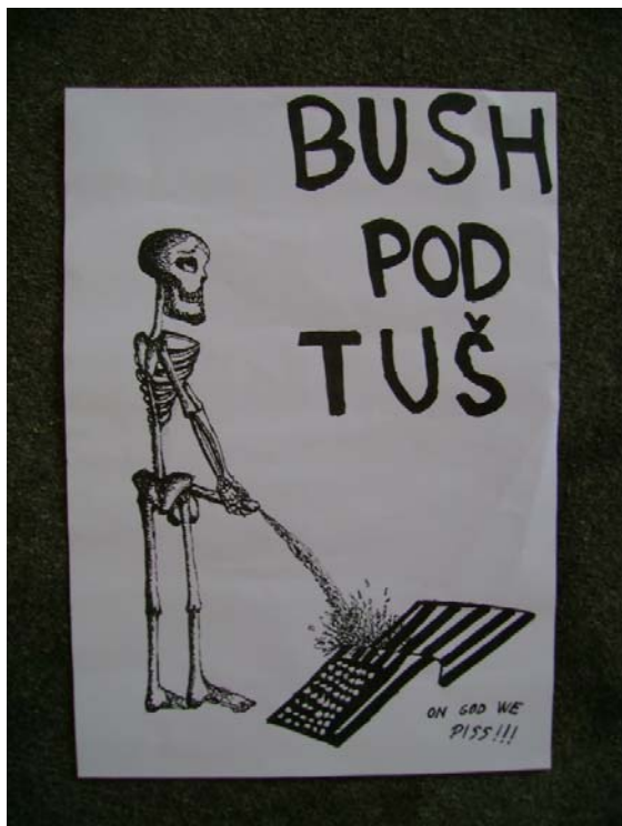
Slika 4.16: Plakat »Bush pod tuš«

vsestransko podporo s strani tistih, ki so omogočili uprizoritev Bushevega propagandnega shoda za NATO (Buzeti, intervju).