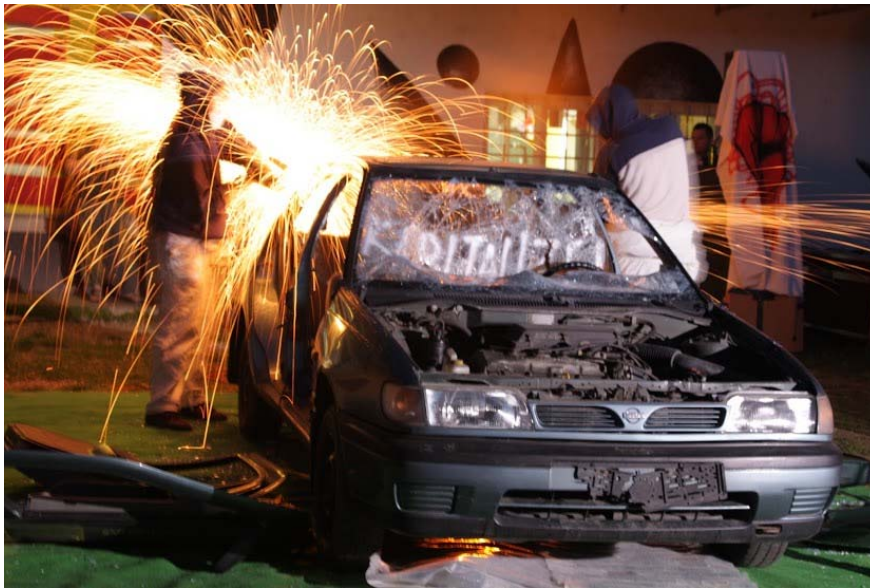
Slika 4.19: Umetniška intervencija »1. maj«