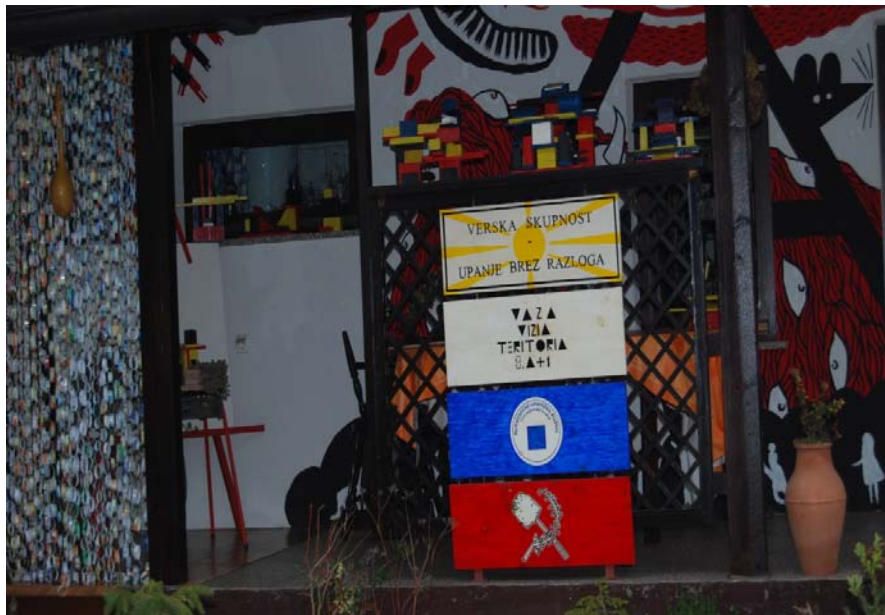
Slika 4.3: Vaza Vizia teritoria 8. a + 1 v Beltincih