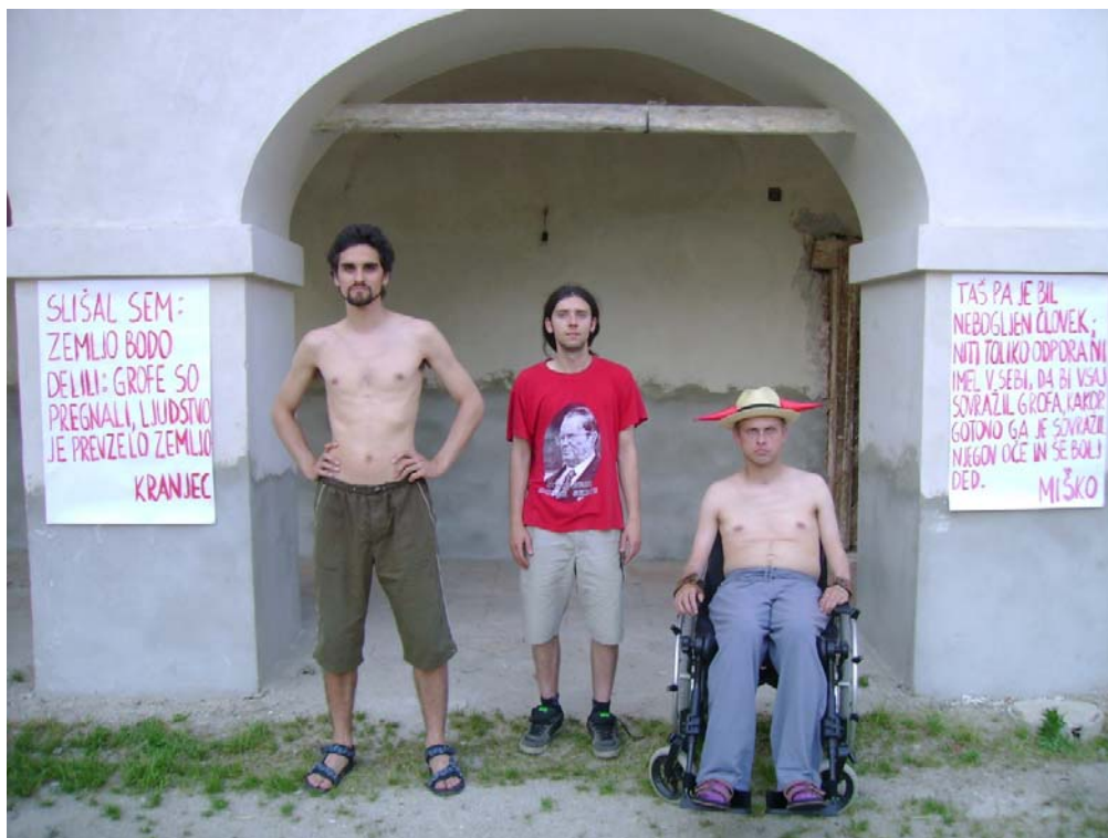
Slika 4.7: Plakaterska akcija Narodno-zabavnega terorizma pred beltinskim gradom

V okviru projekta glasbeno-političnega kolektiva Narodno-zabavni terorizem maja 2008 pred gradom v Beltincih poteka še fotografsko-plakaterska akcija, posvečena absurdnosti dolgotrajnega denacionalizacijskega 33 postopka beltinskega gradu.