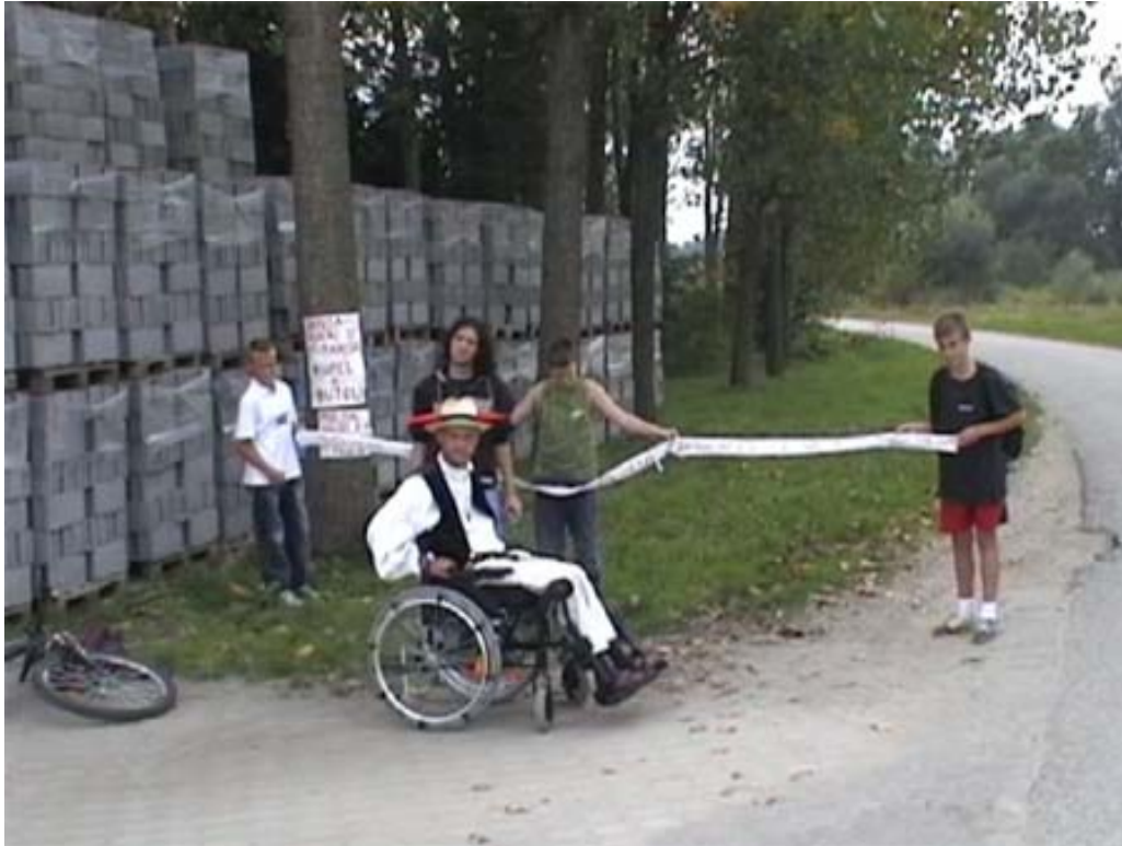
Slika 4.4: Performans »Stop, policija – Hotiza!« na Hotizi