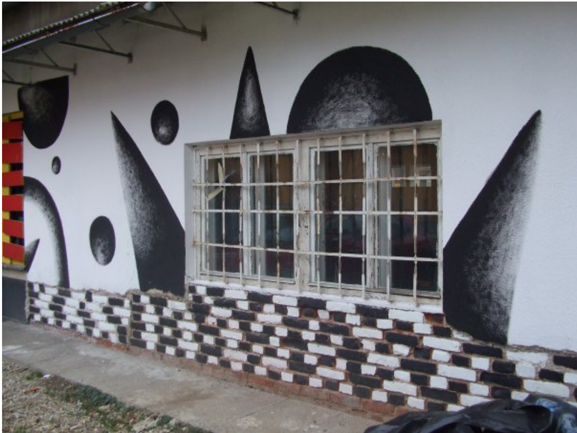
Slika 4.10: Pogled na Ambasado z zadnje strani oziroma s Trga Karla Marxa