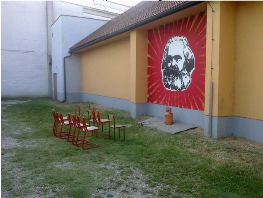
Slika 4.18: Alternativna (ne)proslava na Trgu Karla Marxa