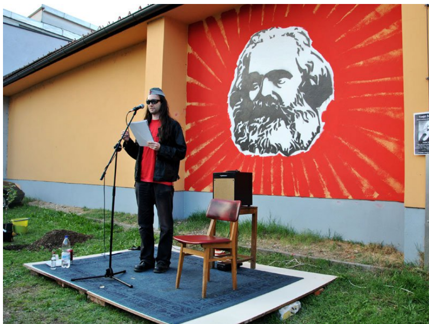
Slika 4.17: Odprtje Trga Karla Marxa; v ozadju »marksistični čudež«