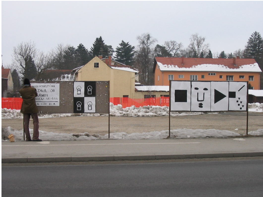
Slika 4.13: Konstruktivistična razstava ob kulturnem prazniku (4.–8. februar 2006)