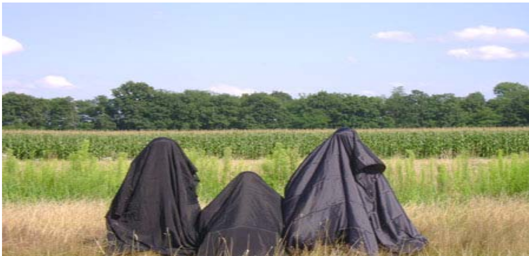
Slika 4.8: Umetniški performans »3x-no brezglavi Triglav«