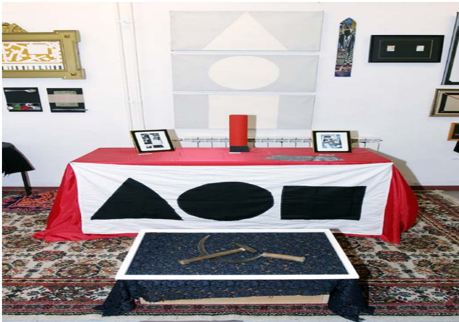
Slika 4.6: Oltar Verske skupnosti Upanje brez razloga