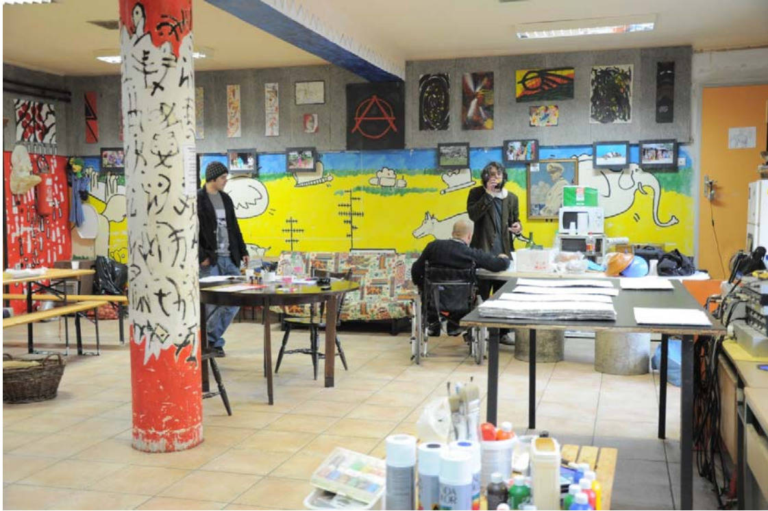
Slika 4.9: Osrednji prostor Ambasade