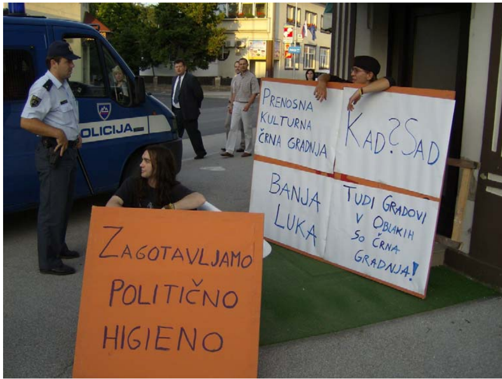
Slika 4.14: Okoljsko, kulturno in politično ozaveščeni performans v centru Beltinec