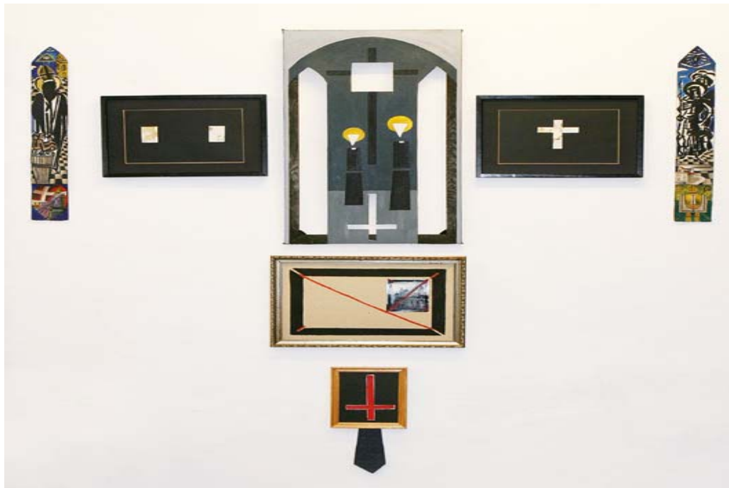
Slika 4.2: Sporno Kavaševno umetniško delo po seciranju