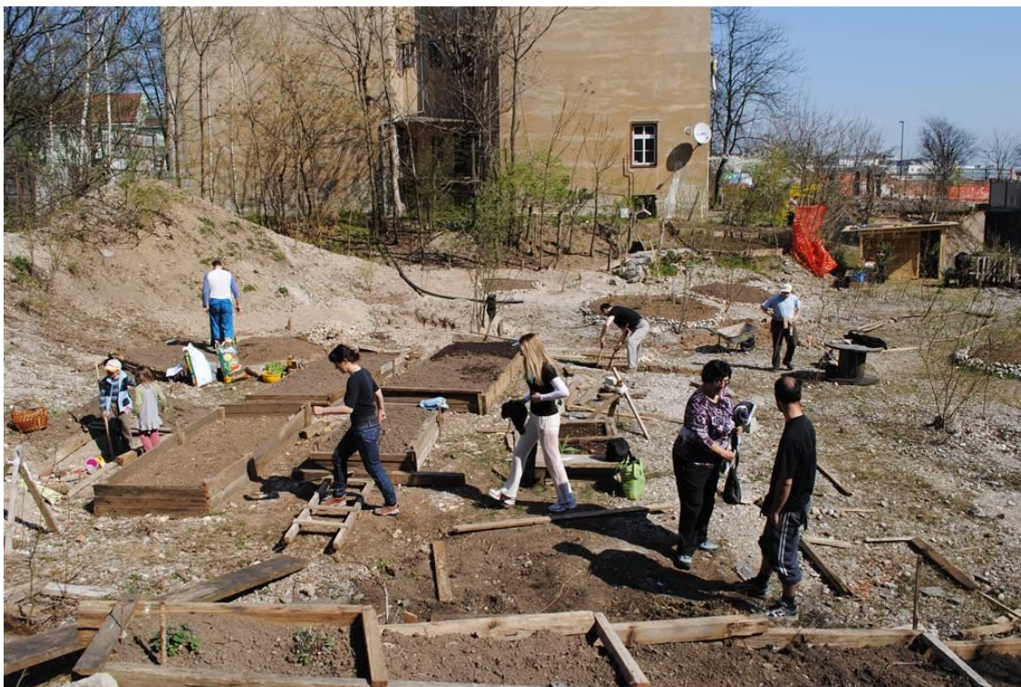
Slika 6.1: Urejanje vrtičkov Onkraj gradbišča

Bunker je pred izvedbo programa Vrtovi mimo grede izvedel sociološko in antropološko raziskavo, vezano na sosesko Tabor; raziskavi pa sta pokazali, da prebivalci soseske pogrešajo zelene prostore in možnost druženja, ki ni nujno pogojeno s 'posedanjem na kavi' in zapravljanjem denarja. Rezultati raziskav in pa sama zaraščenost gradbišča so tako počasi nakazovali, v katero smer se bo razvijal projekt Onkraj gradbišča.