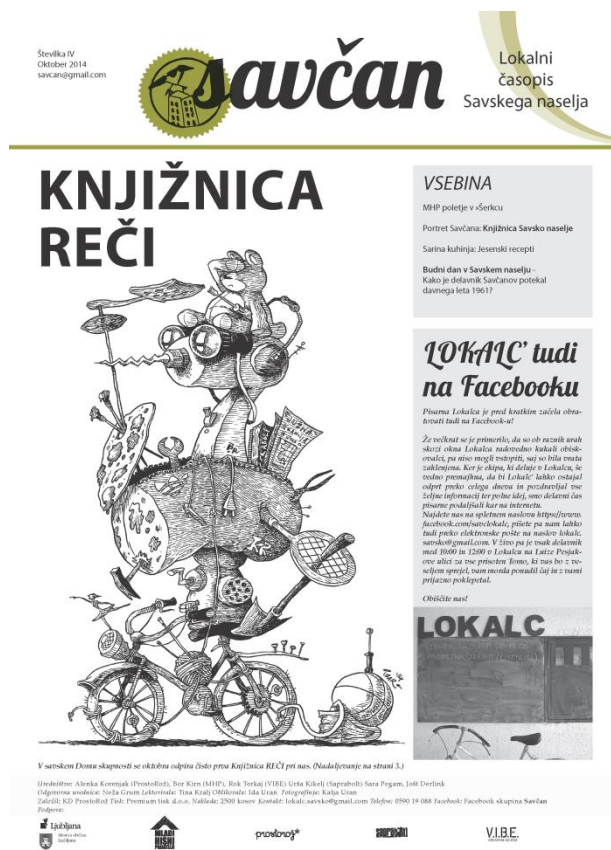
Slika 6.2: Naslovnica lokalnega časopisa Savčan

Kot enega izmed kanalov so uporabili tiskani medij, in sicer so začeli izdajati časopis Savčan (glej sliko 6.2), ki je izhajal, dokler je prenova v naselju aktivno potekala. V uredniškem odboru časopisa so bile članice društva prostoRož in nekateri prebivalci naselja, prispevki pa so bili vezani predvsem na dogajanje v Savskem naselju, zgodbe in novice, zanimive za prebivalce, občasno pa so se tudi lokalna podjetja odločila in objavila svoje oglase. Za izdajanje časopisa so se odločili, ker so ugotovili, da preko družbenih omrežij ne dosežejo vseh prebivalcev, in tako nekateri o dogajanju niso bili obveščeni. Časopis pa so v tiskani izdaji razdelili v vse nabiralnike in s tem povečali krog obveščene javnosti.