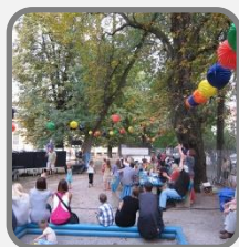
Tabela 2. 1: Primeri skupnostnih praks v urejanju prostora v Ljubljani