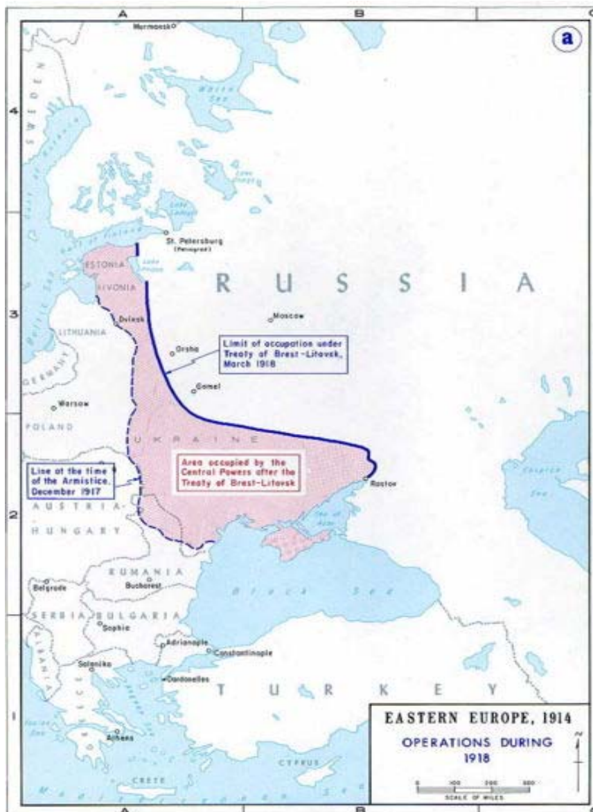
Slika 5.1: Brest-litovski sporazum