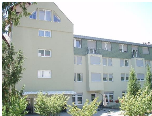
Slika 3.3: Objekt »novi prizidek« Trubarjevega doma upokojencev Loka pri Zidanem Mostu (desno)