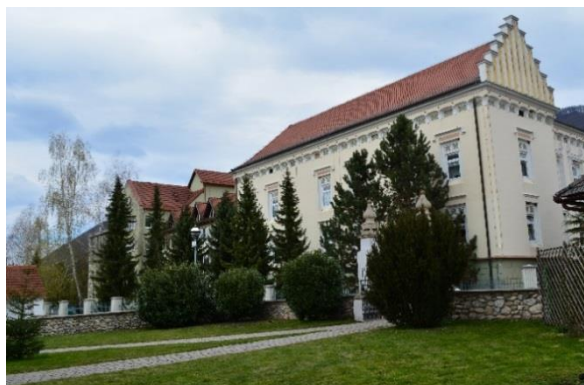
Slika 3.2: Dvorec Trubarjevega doma upokojencev Loka pri Zidanem Mostu z južne strani (levo)