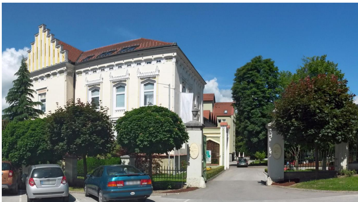
Slika 3.1: Dvorec Trubarjevega doma upokojencev Loka pri Zidanem Mostu z vzhodne strani