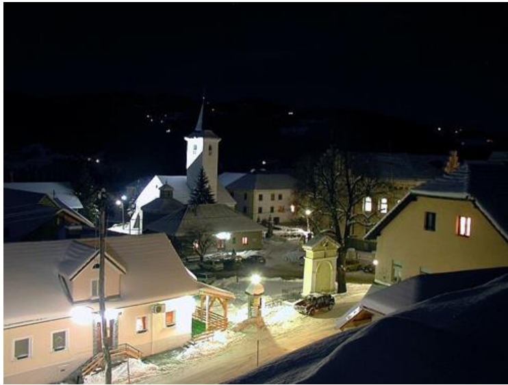
Slika 3.5: Loka pri Zidanem Mostu v zimski noči