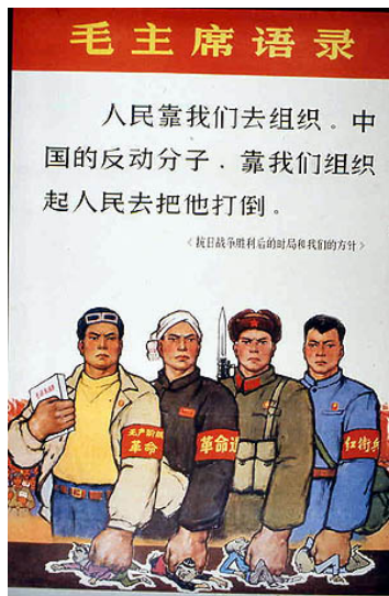
Slika A. 8: Izrek predsednika Maa Zedonga: »Ljudstvo se zanaša na nas za organizacijo; reakcionarne elemente Kitajske mora ljudstvo poraziti pod našim vodstvom«

»Ta propagandni plakat je klasičen primer umetnosti rdeče garde iz zgodnje kulturne revolucije in ponazarja protikolonialistično, protiimperialistično ikonoklastično retoriko, ki je vztrajala tudi v 1960-ih. Bodite pozorni, da delavec uničuje tako krščanski križ kot tudi budistični kipec in klasična kitajska besedila.« ( ibidem )