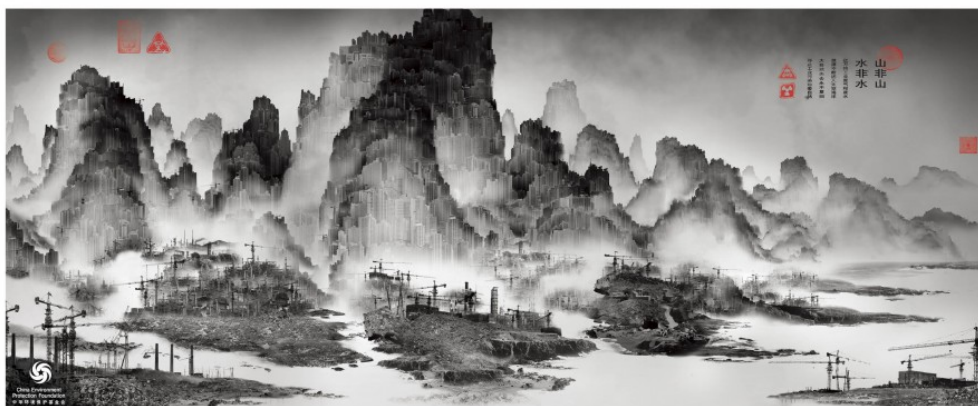
Slika A. 4: Naj so gore gore in reke reke

Title: Industrial Pollution Headline Translation: Let the hills be hills and the rivers be rivers.