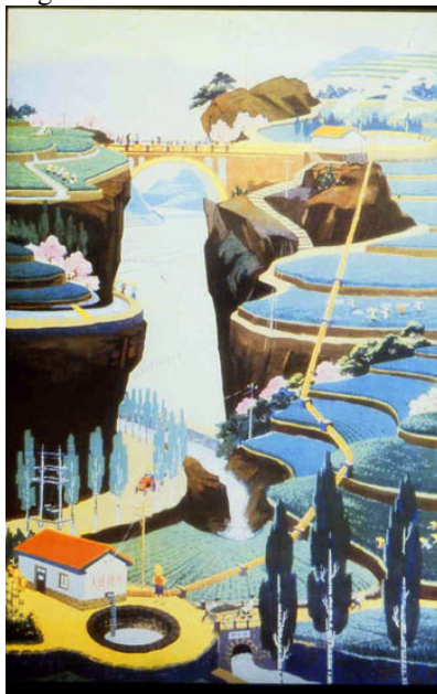
Slika A. 2: Človek mora premagati naravo