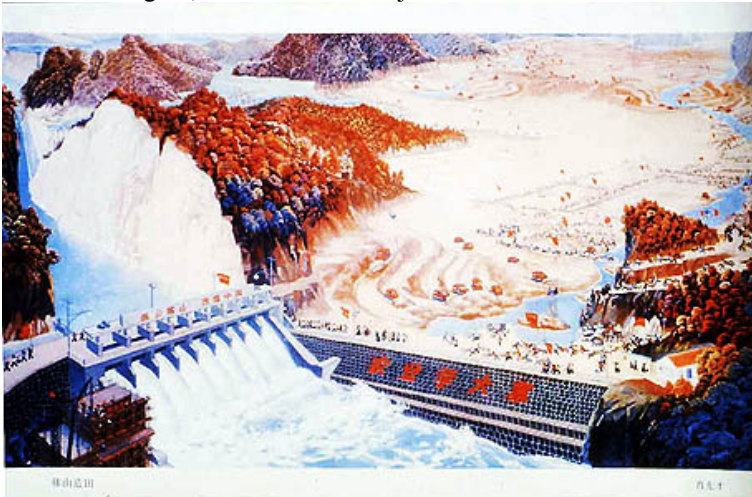
Slika A. 3: Premaknimo gore, da ustvarimo zemljo