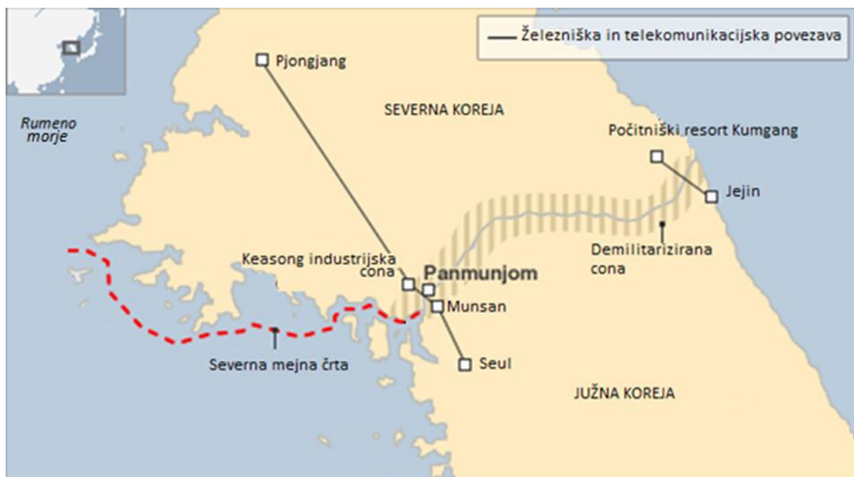
Tabela 1: Demarkacijska črta, ki ločuje Severno in Južno Korejo

ujetnikov in 37.000 civilnih ujetnikov. Ženevska konvencija o vojnih ujetnikih iz leta 1949 je podrobno določala osnovne pravice vojnih ujetnikov in zahtevala, da je potrebno ujetnike po prekinitvi ognja brez odlašanja izpustiti in vrniti. Veliko vojnih ujetnikov, ki so jih zajeli pripadniki Južnokorejske vojske, se ni hotelo vrniti v Severno Korejo. Med njimi tudi prek 15.000 kitajskih ujetnikov, ki so želeli biti vrnjeni na Tajvan. Predsednik Rhee je skušal sabotirati pogajanja, zato je izpustil 25.000 antikomunističnih ujetnikov, a je Mao Zedong pravilno ocenil, da bodo ZDA priselile predsednika Rheeja, da sprejme dogovor ne glede na to, ali se z njim strinja ali ne. Skladno s končnim dogovorom nihče od vojnih ujetnikov ni bil vrnjen proti lastni volji (Crump 2007, 83–86).