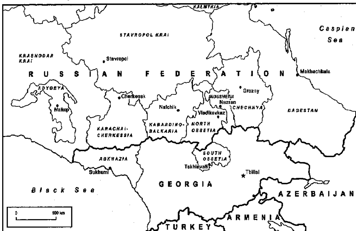
Slika 5.1: Zemljevid Kavkaza

Regija Severnega Kavkaza velja za eno najbolj etnično in jezikovno raznolikih delov sveta 13 . Zajema osem republik v okviru RF, in to so: Čečenija, Dagestan, Ingušija, Severna Osetija, Kabardino - Balkarija, Karačevo - Čarkezija, Kalmikija in Adigeja (glejte sliko 5.1). Severno od »etničnega« Severnega Kavkaza ležijo še tri etnično ruske regije, kjer prevladuje kozaško prebivalstvo, ki pa se že zgodovinsko uvršča v regijo Severnega Kavkaza. To so: Krasnodar, Stavropol in Rostov (Melvin 2007).