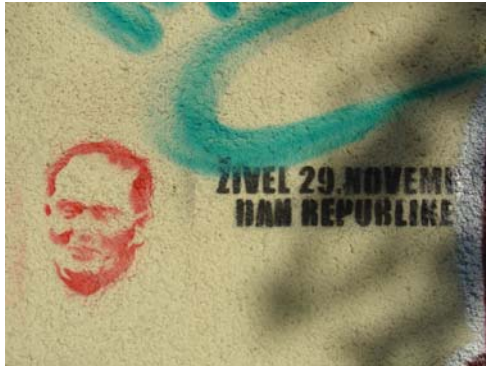
Slika 28: Obujanje obdobja iz časa življenja Josipa Broza Tita (Ljubljana)

Grafiti z jugoslovanskimi simboli so predvsem domena večjih mest, kjer smo zasledili nekatere jugoslovanske simbole - zvezdo, grb, kratico KPJ in podobo Tita. Največ jugonostalgčnih vsebinskih napisov se navezuje na Josipa Broza Tita: »ŽIVIO TITO«, »TITO JE ČLOVEK, NAMREČ KONJI IMAJO ROGOVE«, »TITO JE MEL VELIKO KITO«, »TITO V RITO!«, »TITO JE NAŠ« (Tito prečrtano in dopisano »ADOLF«, op. M. N. ), »TITOTA NAZAJ!!!«, »TITO = DIKTATOR«.