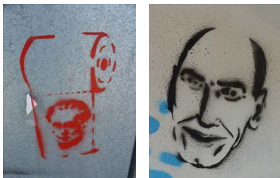
Slika 32: Provokativna upodobitev Tita na toaletnem papirju (Ljubljana)

Med najbolj neposredne in vizualno opazne politične grafite lahko prištevamo grafitne šablone s podobami politikov. V obdobju našega raziskovanja so se v Ljubljani pojavile šablone Janeza Janše, Tita in Jaserja Arafata.