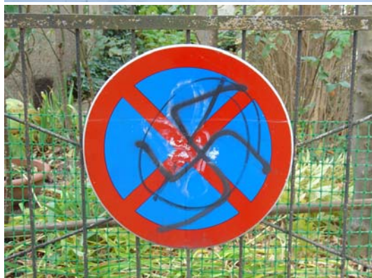
Slika 3: Grafitarji se pri svojih sprejarskih izbruhih poslužujejo različnih lokacij, celo prometnih znakov (Ljubljana)