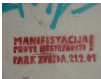
Slika 7: Poziv na manifestacijo za solidarnost s pribežniki in protest proti nestrpnosti, ki se je zgodil 21. februarja 2001 na Kongresnem trgu v Ljubljani.

Leburićeva in sodelavci so pri časovnem umeščanju splitskih grafitov uporabili večkratno beleženje napisov na istih lokacijah in v različnih časovnih obdobjih. Na ta način so dobili podatke o svežini barve razpršilcev, s katerimi so nastali grafiti (Lalić, 1991: 61). Časovna dinamika nastajanja napisov, ki se vsebinsko navezujejo na specifično družbeno-politično dogajanje, je običajno precej predvidljiva. Problematično je predvsem datiranje t.im. 'brezčasnih grafitov', ki bi jih lahko na podlagi vsebine uvrstili v katero koli časovno obdobje. Tak grafit je na primer »DEMOKRACIJA JE NAŠA UTOPIJA!!!«, ki bo z vidika raziskovalca in nenazadnje ustvarjalca tovrstnih napisov vedno aktualen.