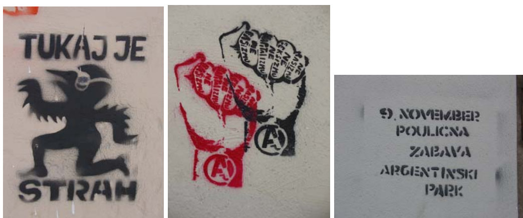
Slika 29: Odgovor skrajnežem neonacistične ideologije s strani neformalne, samo-organizirane mreže TEMP (Ljubljana)

Šablonske grafite so uporabili tudi aktivisti, ki zagovarjajo protifašistično ideologijo.