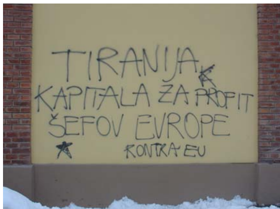
Slike 15: Navajanje razloga za nasprotovanje vključitvi Slovenije v EU (Ljubljana)

diskurza«, »uravnoveženih informacij«, ko pravzaprav ni bilo »prave razprave«, je to »skoraj po definiciji izločilo vse pomembnejše poskuse kritičnega analiziranja prednosti in slabosti članstva v EZ«. Prav ta obsedenost z evropskostjo, Evropo, je nujno sprožila nasprotna mnenja (Velikonja, 2005: 84).