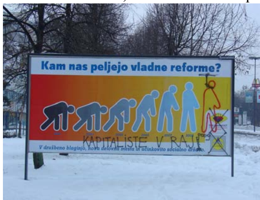
Slika 2: Grafit na jumbo plakatu se je pojavil času množičnih demonstracij delavcev, študentov, dijakov, kulturnikov, javnih uslužbencev, upokojencev in številnih drugih nasprotnikov reform, ki so potekale 26. 11. 2005 v Ljubljani (Ljubljana)