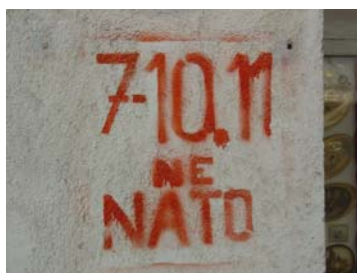
Slika 6: Poziv k demonstracijam proti NATO paktu, ki so potekale od 7 – 10. novembra 2002 v Ljubljani.

Časovno umeščanje grafitov je pogosto oteženo, razen v primerih, ko se čas nastanka nedvoumno izraža prek vsebine napisa (glej sliki 6 in 7).