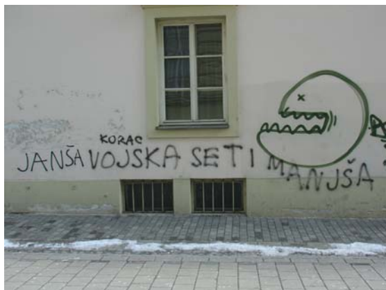
Slika 26: Odklonilen odnos do napotitve slovenskih vojaških inštruktorjev v Irak (Maribor)

odločitev o napotitvi štirih vojaških inštruktorjev v Irak 73 , ki je v javnosti povzročila precej neodobranja in kritik, komentirali z grafiti: »JANŠA GO HOME«, »OSAMA DOBRODOŠEL«, »CAFE BAGDAD«, »IRAK POŽIVLJA«, »JANŠA VOJSKA SE TI MANJŠA«, »V IRAK? ZA KOZLAT«, 4 = PREVEČ«, »V IRAK« (napis, usmerjen s puščico), »IRAK, NE HVALA«, »SAS = SLOVENSKA AGRESORSKA STRANKA... VOLILNO OKROŽJE 1 = BAGDAD«.