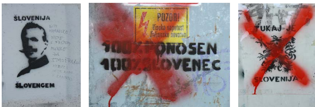
Slika 9: Šablonski grafiti aktivistov skrajno desno usmerjenega družbenega gibanja Tukaj je Slovenija (Ljubljana)

Decembra 2005 so aktivisti skrajno desno usmerjenega družbenega gibanja Tukaj je Slovenija 24 , v središču Ljubljane izdelali nekaj izrazito pro-slovenskih nacionalističnih grafitov, ki z ideologijo, predstavljeno na spletni strani 25 , spominjajo na subkulturo obritoglavcev (patriotizem, rasizem, nacionalizem in nacizem). To so grafiti »SLOVENIJA SLOVENCEM« s sliko Rudolfa Maistra 26 , »TUKAJ JE SLOVENIJA« s sliko karantanskega panterja 27 , »100% PONOSEN...100% SLOVENEK«. Vsi omenjeni grafiti so bili kmalu zatem prečrtani ali izbrisani (glej slike 9).