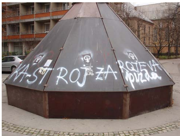
Slika 24: Ostre kritike Drobničevega osnutka strategije za dvig rodnosti (Ljubljana)

drugih javnih osebnosti. Ostre kritike osnutka strategije, katere cilj naj bi bil dvig rodnosti, so se med drugim odrazile prek grafitov, kot sta »ŽENSKA – STROJ ZA ROJEVANJE« in »RAJE EPRUVETA – KOT DROBNIČ ZA OČETA«.