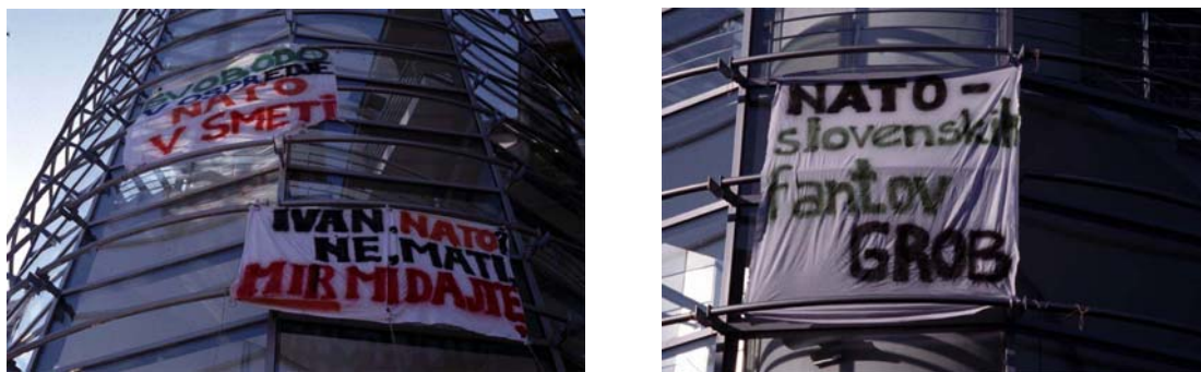
Slika 13: Akcija v sklopu proti-natovske kampanje na Fakulteti za družbene vede (Ljubljana) 44

Ena od medijsko odmevnih akcij v sklopu proti-natovske kampanje, v kateri je nastalo veliko grafitov, je bilo nočno grafitiranje in razobešanje treh, s proti-natovsko vsebino popisanih, rjuh na stekleni stolpič Fakultete za družbene vede 43 .