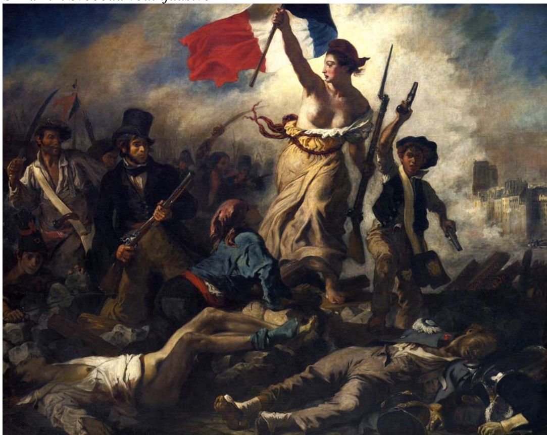
Slika 4.2: Svoboda vodi ljudstvo