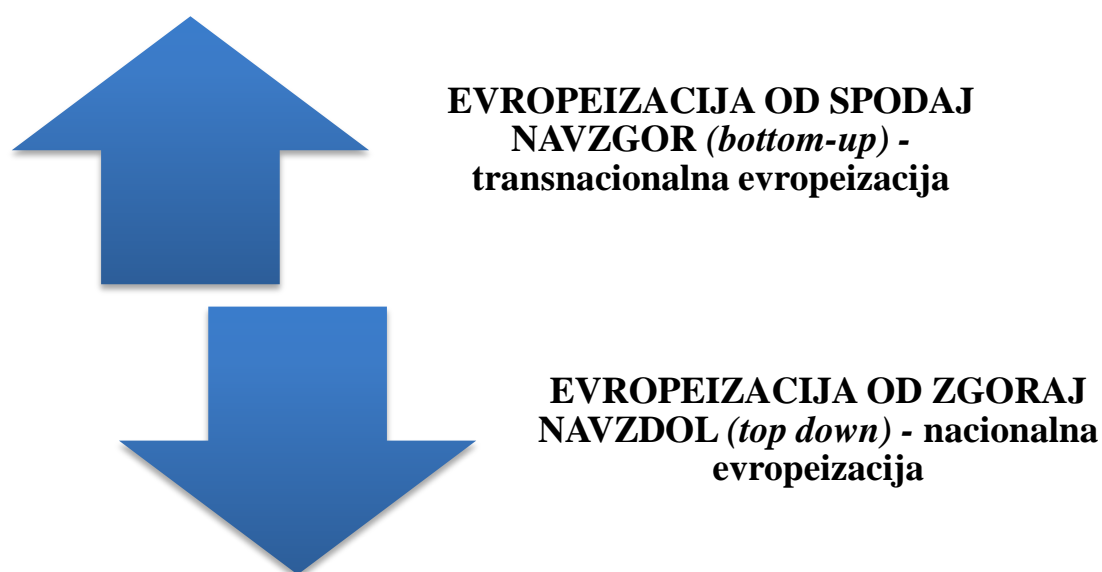
Slika 2.3: Dva pristopa proučevanja evropeizacije