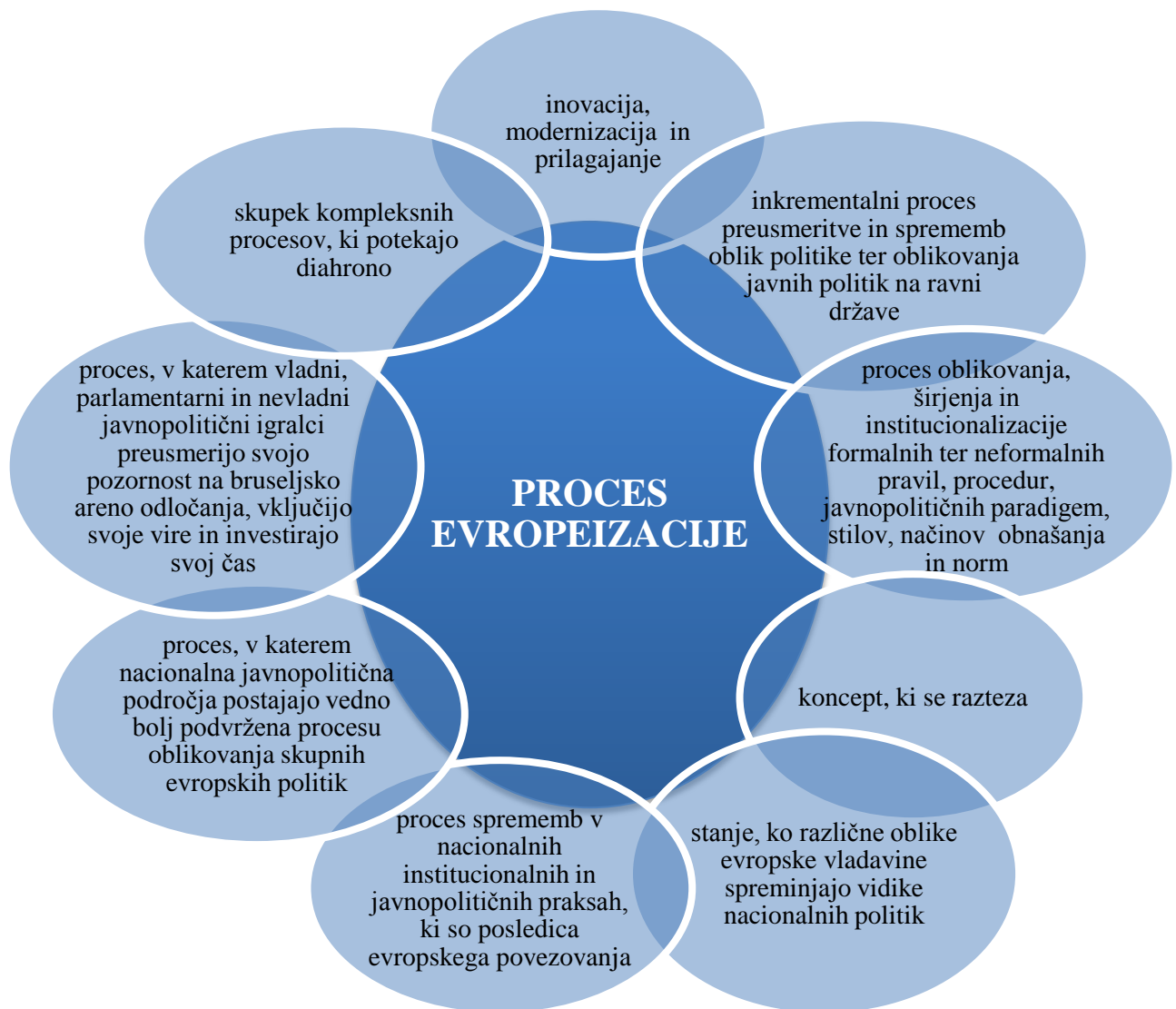
Slika 2.2: Različne konceptualizacije procesa evropeizacije