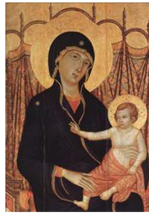
Slika 4.2: Duccio di Buoninsegna, Rucellai Madonna (detail 1) 1285