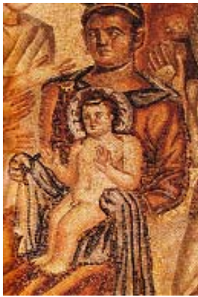
Slika 4.1: Mozaik iz »Dionizove hiše« v Paphosu iz 4. stoletja

Tako kot je Jezus je tudi Dioniz rojen kot sin device. Mati Dioniza, Semela, je čudežno zanosila s pomočjo Zevsove strele, ker si je tako močno želela videti Zevsa v vsej njegovi slavi. Čez sedem mesecev se je rodil Dioniz (Freke in Gandy 1999, 29). Tudi Marija, mati Jezusa, je rodila po sedmih mesecih nosečnosti. Če primerjamo Sliko 4.1 in Sliko 4.2, bi na prvi pogled lahko rekli, da gre za upodobitvi istih oseb. Vendar je na prvi sliki upodobljen poganski rešitelj Dioniz, kot otrok s svojo materjo, na drugi pa Jezus s svojo materjo Marijo (Freke in Gandy 1999, 153). Smrke pravi, da je »... božič dokaj povprečna (ob)rojstna legenda–pripovedni miks, ki posnema, ponareja, združuje in preigrava že dolgo znane popularne mitološke motive in refrene.«, torej je krščanstvo, glede na podobnost slik, črpalo tudi iz grške religije. Justin iz 2. stoletja, katoličanom znan kot Justin mučenec, pa je npr. deviško spočetje Bachusa ali Dioniza štel za plagiat biblije, ne glede da to, da vemo, da so poganska verstva starejša (Smrke 2010).