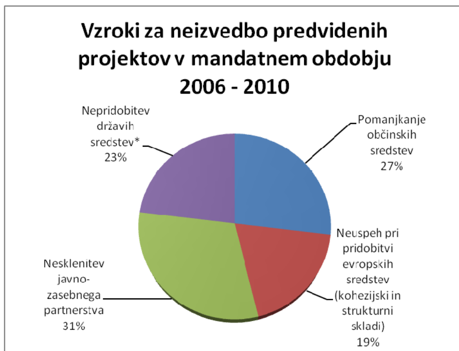
Graf 4.2: Prikaz vzrokov za neizvedbo predvidenih projektov v mandatnem obdobju 2006-2010