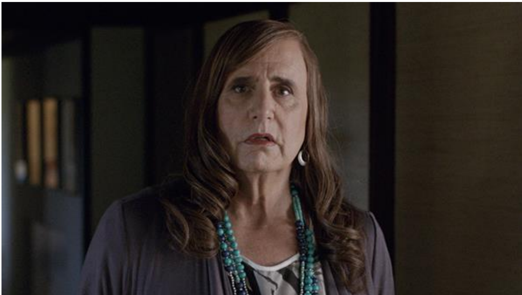
Slika 3.1: Jeffery Tambor v vlogu Maure Pfefferman.

Čeprav sta Maurino razkritje in tranzicija glavna tematika nadaljevanke, je velik poudarek tudi na prikazu judovskih običajev, njihovo vpetost v vsakdanje življenje, kar pa ne bo tematike te naloge.