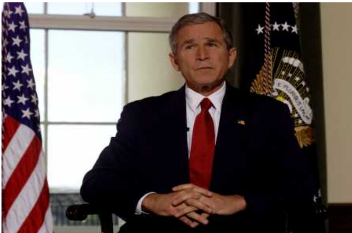
Slika 6: Predsednikov govor na dan napada na Afganistan, 7. oktobra 2001