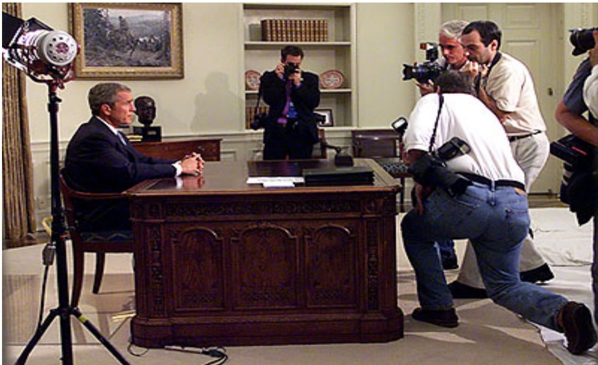
Slika 2: Predsednikov govor iz Ovalne pisarne na dan terorističnih napadov