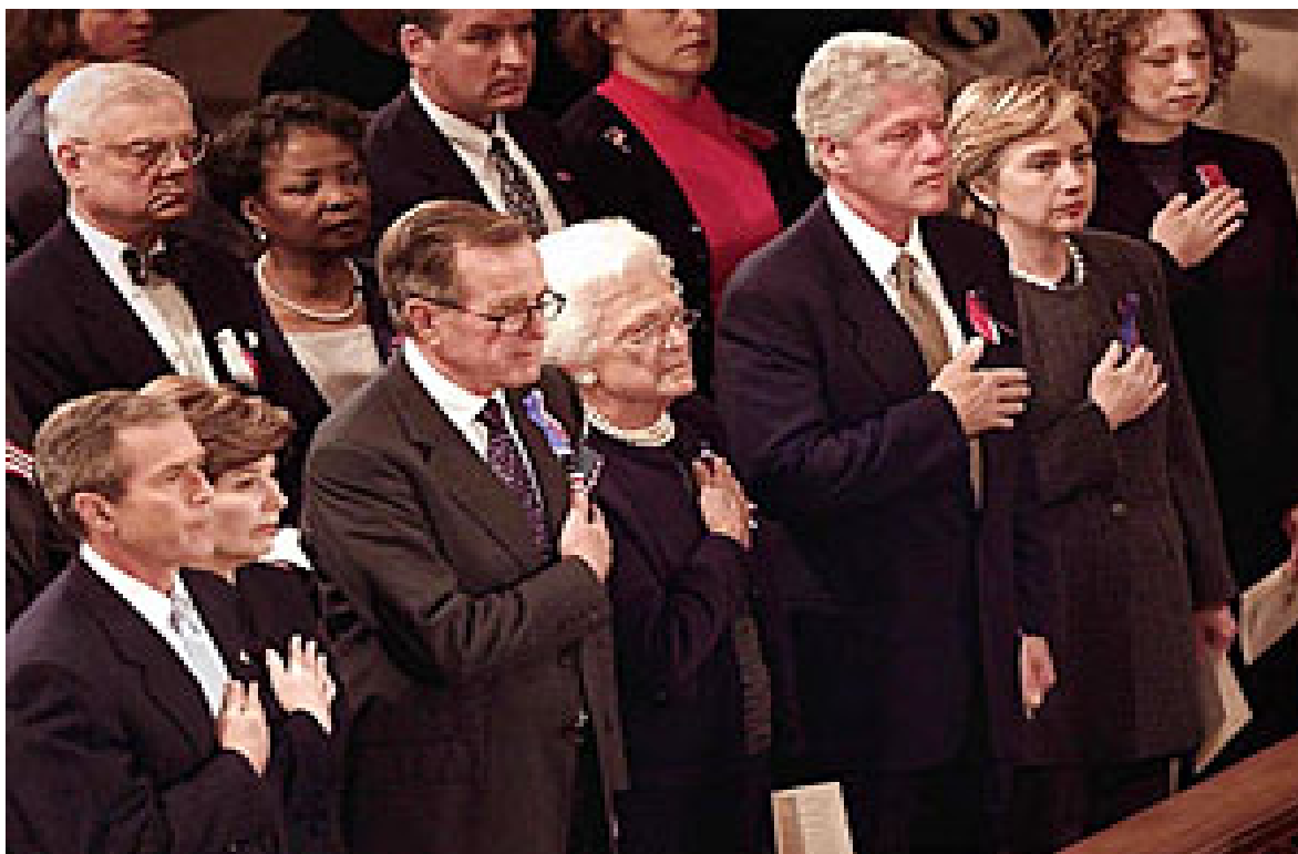
Slika 5: Molitev v nacionalni katedrali