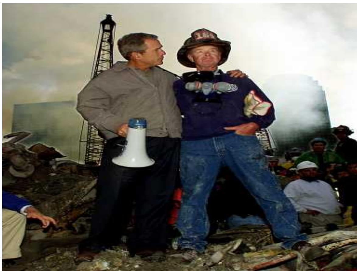
Slika 4: Predsednikov obisk Točke nič