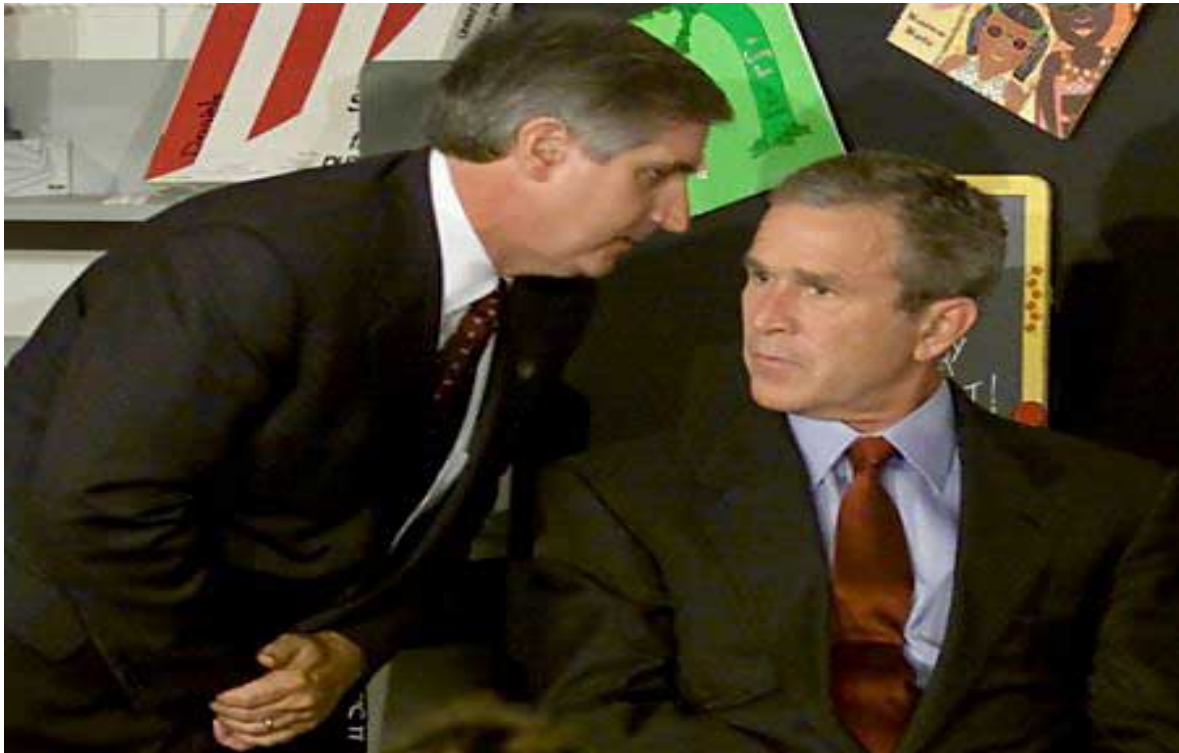
Slika 1: Predsednik Bush izve za napad na WTC