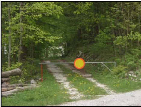
Fotografija 5.1 in 5.2: Primera ograd na dovozu do vikenda