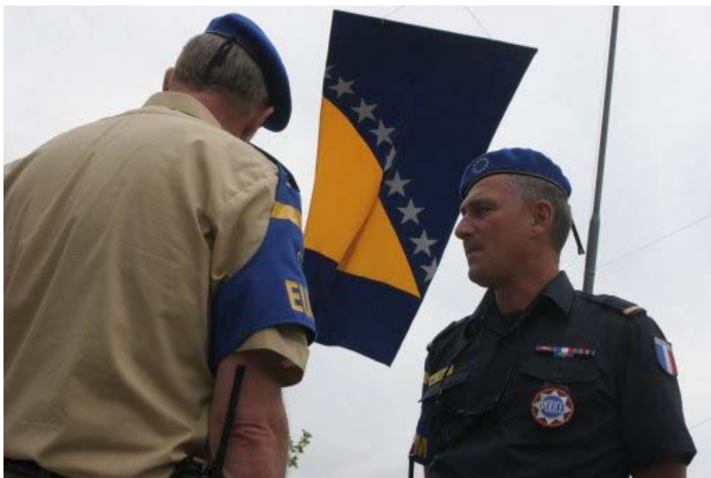
A.7: Pripadnika EUPM pod zastavo BiH.