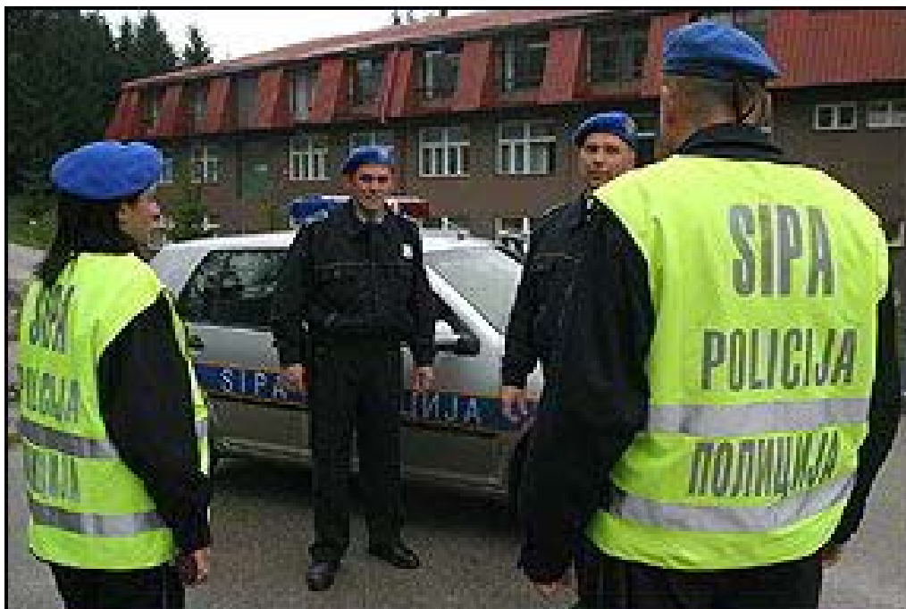
A.8: SIPA v BiH pri delu s podporo EUPM.