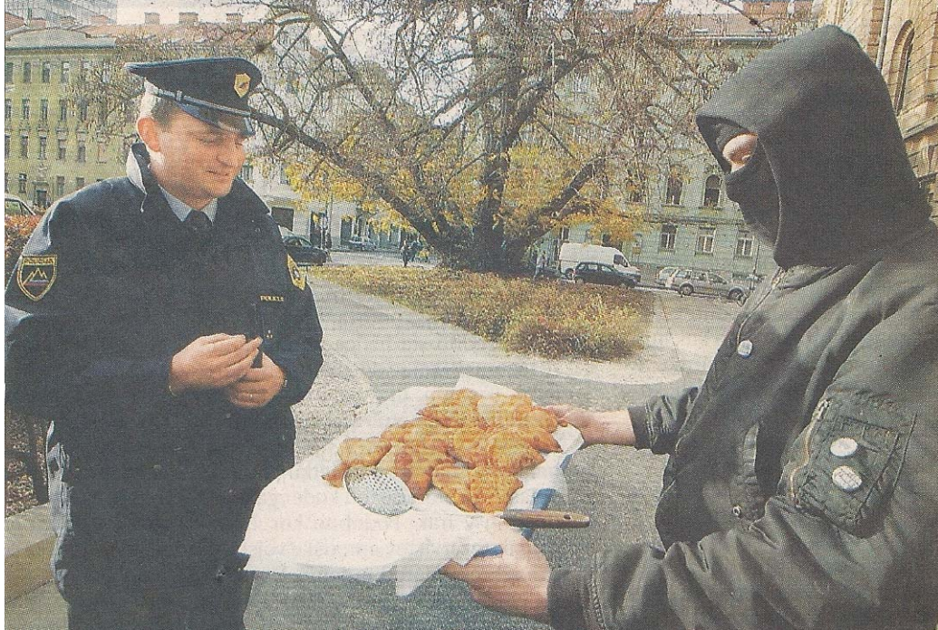
Slika 5.1: Fotografija akcije »teroristična« zabava proti »slovenskemu terorističnemu sodstvu« pred Okrožnim sodiščem v Ljubljani, 2003.