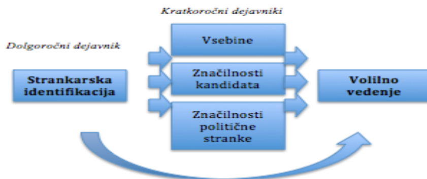
Slika 2.2: Michiganski model volilnega vedenja