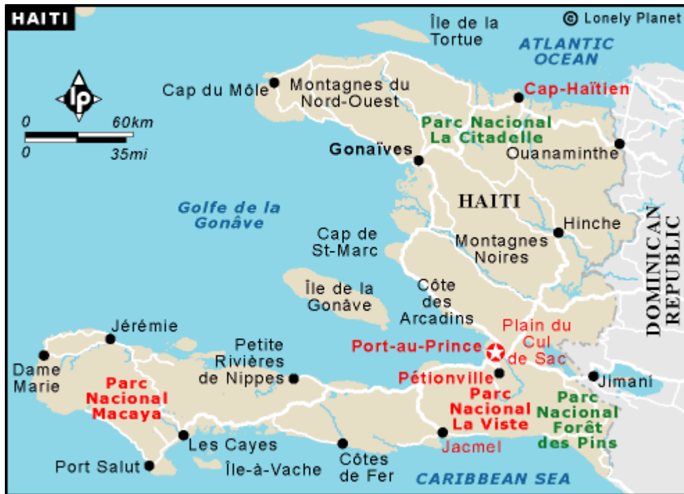
Slika A.1: Prikaz območja Haitija