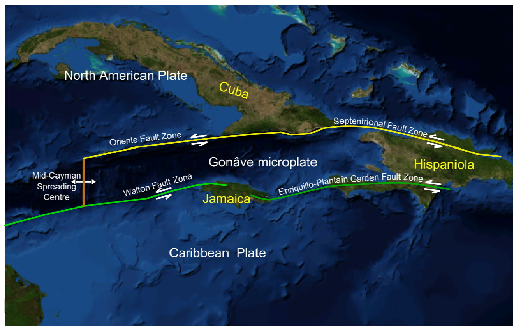
Slika A.2: Prikaz regionalnih tektonskih prelomnic