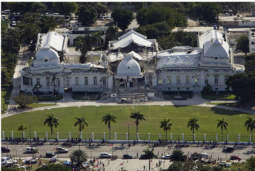
Vir: Wikipedija (2010c).