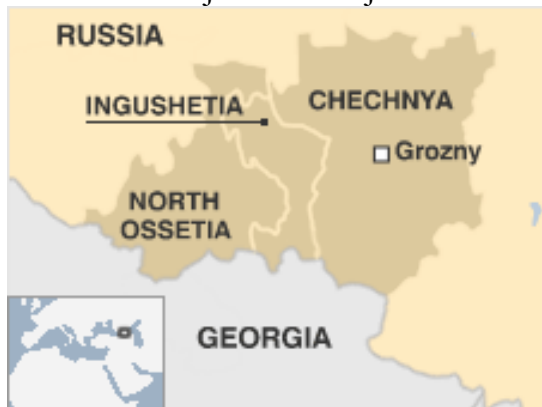
Slika 3.1: Zemljevid Čečenije