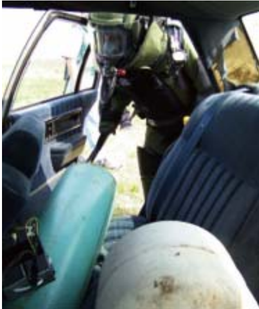
Vir: Red Hat Publishing Company, Inc. (2010).