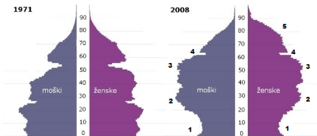
Slika 2.1: Prebivalstvena piramida za Slovenijo – 1971 in 2008

prebivalstva v letih 1971 in 2008 v obliki prebivalstvene piramide. Prebivalstvena piramida ima obliko prave piramide takrat, ko so najštevilčnejša skupina prebivalstva otroci (v spodnjem delu je piramida najširša), proti vrhu pa se oži, saj s staranjem narašča verjetnost smrti. Taka oblika piramide je značilna za mlada prebivalstva. Prebivalstvena piramida Slovenije v letu 1971 je pogojno še podobna piramidi, medtem ko za tisto iz leta 2008 tega ne moremo več trditi, saj že predstavlja staro prebivalstvo. Prebivalstvene piramide starih prebivalstev spominjajo na vazo, saj so zaradi daljšega življenja, manj rojstev in posledičnega večanja deleža prebivalstva v višjih starostih, vrhovi piramid vse bolj kopasti, spodnji deli, ki predstavljajo mlado prebivalstvo, pa se vse bolj ožijo.