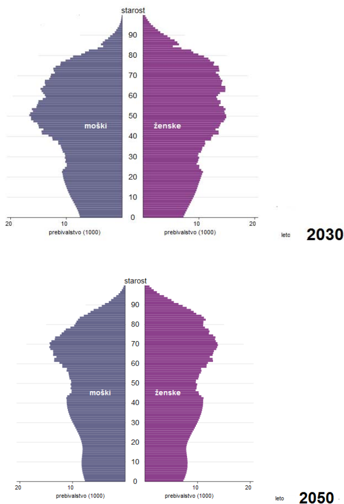
Slika 2.2: Prebivalstvena piramida za Slovenijo – projekciji 2030 in 2050

Projekciji prebivalstvenih piramid za leto 2030 in 2050 kažeta, da bo starostna struktura slovenskega prebivalstva še bistveno manj ugodna kot danes. Danes je namreč večina predstavnikov številčno močnih generacij, rojenih po drugi svetovni vojni, še vedno delovno aktivna. Iz projekcij prebivalstvenih piramid pa je razvidno, da se bodo te generacije čez nekaj let začele množično upokojevati, na trg dela pa bodo začele vstopati številčno precej šibkejše generacije. Pričakovane demografske spremembe zato zahtevajo sistematične ukrepe v prebivalstveni in zaposlitveni politiki ter politiki javnih financ.