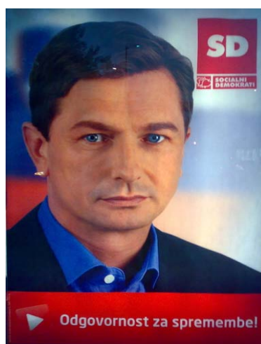
Slika 4.5: Plakat stranke SD leta 2008

Nekoliko drugačen, na preteklo predvolilno kampanjo, je bil plakat s predsednikom stranke SD leta 2008. Ta ni imel več rdeče obrobe, ki bi spominjala na osmrtnico, pač pa je bil na plakatu bil Borut Pahor, medtem ko je v njegovem ozadju vidna slovenska zastava, kar prikazuje slika 4.5. Ta volilna kampanja SD pa je nosila slogan »Odgovorni za spremembe!«.