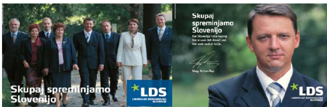
Slika 4.2: Plakat stranke LDS leta 2004