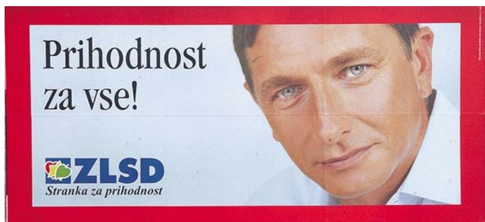
Slika 4.3: Plakat stranke ZLSD leta 2004

Na volitvah leta 2004 je ZLS nastopila z enim plakatom, s sloganom »Prihodnost za vse!«. Na tem plakatu je v ozadju Borut Pahor predsednik stranke in takratni evropski poslanec. Posebnost tega plakata je, da Borut Pahor, ki je bil predsednik stranke ni kandidiral na teh volitvah, saj je bil evropski poslanec. Posebnost tega plakata je zelo izrazita, plakat je podoben osmrtnici, le da ima ta rdečo obrobo, kar prikazuje slika 4.3.