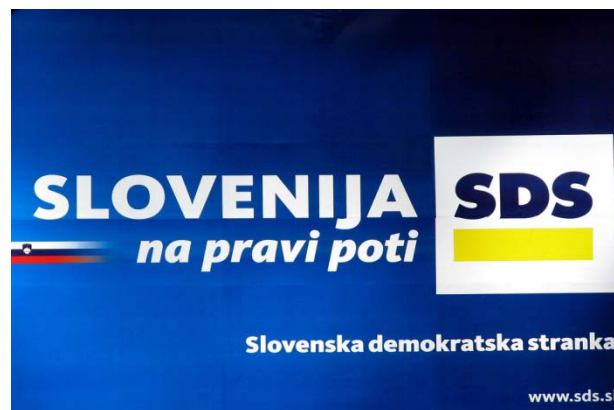
Slika 4.6: Plakat stranke SDS leta 2008

splošnem plakatu ni bilo oseb, ampak le modra podloga na kateri ji bil napisan slogan in logotip stranke. Vprašanje zakaj je ta stranka izbrala takšen splošen plakat tiči v aferi Patria, ki še vse do danes ni raziskana. Vendar to ne pomeni, da strankarski prvaki niso imeli svojih plakatov z svojimi obrazi.