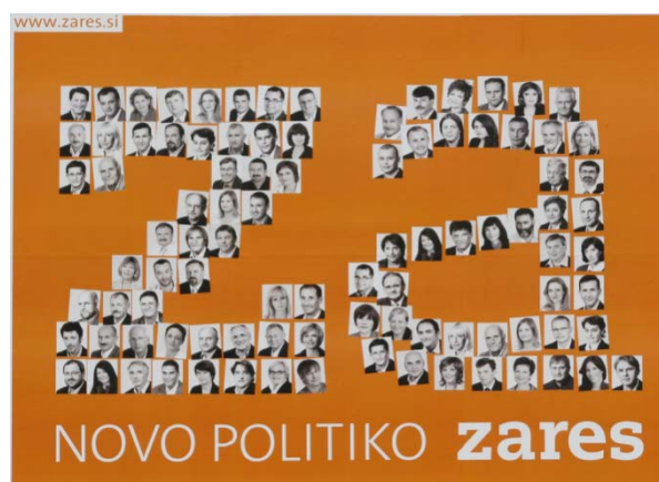
Slika 4.7: Plakat stranke ZARES leta 2008

Na teh državnozborskih volitvah pa se je v predvolilnem času predstavila nova stranka, stranka ZARES, na čelu katere je Gregor Golobič. Ta stranka, se je predstavila z sloganom »Za novo politiko !«, kar prikazuje slika 4.7.