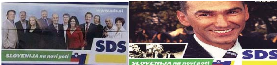
Slika 4.1: Plakata SDS leta 2004

bom predstavila le plakate strank, ki so se leta 2004 in 2008 uvrstile na prva tri mesta po številu poslanskih sedežev v parlamentu.