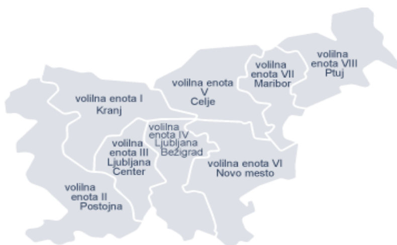
Slika 3.1: Volilne enote v Sloveniji