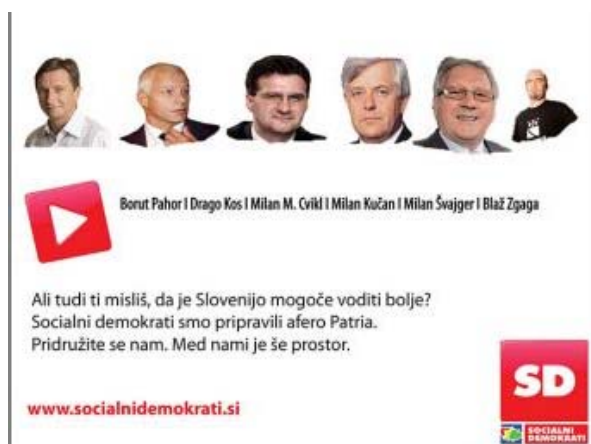
Slika 4.4: Malo spremenjena predvolilna kampanja SD