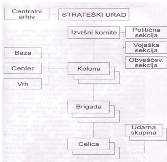
Slika 6.2: Organigram teroristične organizacije Rdeče brigade

Povprečna starost pasivnih članov organizacije (tako moških kot žensk) je bila od 30 do 40 let, njihove povezave z organizacijo pa so običajno segale v čas študijskih let in študentskih nemirov v Evropi, konec 60. in v začetku 70. let. Leta 1992 naj bi imela organizacija le še okrog 50 aktivnih pripadnikov, število podpornikov pa je neznano (Pike 1998).