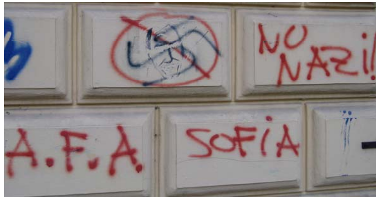
Slika 9.1: Grafitarški konflikt med nacionalisti in antifašisti