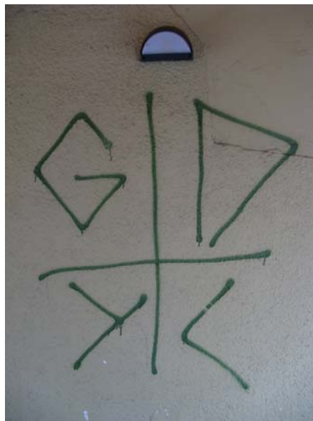
Slika 8.8: Grafit skupine Green Dragons Youth Crew

Nekaj je tudi grafitov mariborskih nogometnih navijačev Virole: »VIOLE«, »VIOLE«, kjer je namesto črke O keltski križ, vendar so ti v manjšini. Keltski križ lahko povezujemo z ideologijo skrajne desnice, na podlagi česar domnevamo, da nogometni navijači povzamejo te vrednote in se v skladu s tem tudi obnašajo. To se kaže tudi v konfliktih, do katerih prihaja med različnimi navijači. Ena od ključnih značilnosti nogometnih navijačev je tudi regionalna pripadnost, ki se prav tako kaže v grafitarskih konfliktih med Green Dragonski in Violami, kar pa bom podrobneje opisala v nadaljevanju.