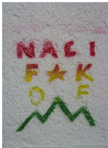
Slika 8.3: Antifašističen grafit proti nacionalistom

V boju proti fašizmu in rasizmu se je v letu 2009 v Ljubljani organizirala koalicija Fronta za svobodo sveta, ki svoja prepričanja predstavlja tudi s pomočjo grafitov. Največ antifašističnih grafitov v Ljubljani se je pojavilo v dneh pred antifašistično manifestacijo ZA SVOBODO SVETA, 29.4.2009. Vsebina grafitov je pozivala ljudi naj se pridružijo manifestaciji in podprejo alternativo ter s tem pripomorejo k gradnji skupnosti in medsebojne solidarnosti. Največkrat so se pojavili grafiti: »TRG OF 27. 4. OB 12 00 «, »SMRT FAŠIZMU ZA SVOBODO SVETA«, peterokraka zvezda v rdeče-črni barvi, »NO NAZI«, »A-FA«, »ANTIFA«, »NAZI FAK«, »ANTIFA CONA« s sliko stisnjene pesti, »«