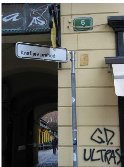
Slika 7.1: Primer grafita na Wolfovi ulici

Kadar govorimo o medijskem prostoru, vsakdo najprej pomisli na množične medije, kot so tisk, televizija in radio. Ker pa množične medije marsikdaj upravlja ekonomski in politični kapital, so se uveljavili tudi alternativni načini izražanja mnenj. Eden izmed teh je tudi grafitiranje, ki za svoj prostor uporablja ulico. Zrinski (2004) pravi, da so se »grafiti razvili v kontekstu urbanega okolja in postali njegov sestavni del«. Trček (2008) meni, da so »grafit, šablona, nalepka fragment življenja ulice«.