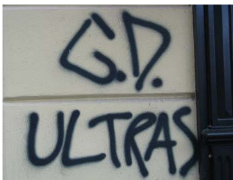
Slika 8.7: Grafit navijaške skupine Green Dragons

Šport je v Sloveniji postal pravi nacionalni ponos, kar se kaže tudi v aktivnosti klubskih navijačev. V Sloveniji sta aktivna ljubljanski nogometni navijaški klub Green Dragons in mariborski nogometni navijači Viole, ki svojo pripadnost klubu izražata tudi izven stadiona, in sicer s pisanjem grafitov. Največ grafitov sem našla v okolici stadiona v Bežigradu, kjer najdemo največ grafitov nogometnih navijačev ljubljanskega kluba Olimpija: »GD«, »GREEN DRAGONS«, »GREEN DRAGONS«, kjer je namesto črke O keltski križ, »G.D. ULTRAS«, »ACAR GD LJ«, keltski križ 7 v katerem so črke »F C O L« (FOOTBALL CLUB OLIMPIJA), križ v katerem so črke »G D Y C« (GREEN DRAGONS YOUTH CREW), »OLIMPIJA«, »OLIMPIJA LJ«, »CENTR LUBLANA«, »ANTI VIOLA CLUB«, »JEBEŠ TOTE ŠTAJERCE«, »BODI PRAVI LJUBLJANČAN! VSI ZA OLIMPIJO! VSI V MB! 9:30 – 24. 10. '07!«, drugače pa se njihove inicialke »GD« pojavljajo po celotnem centru Ljubljane.