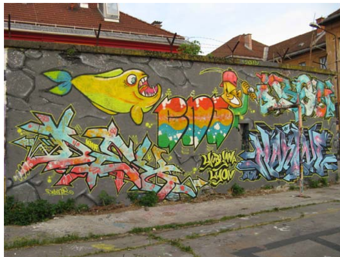
Slika 3.2: Stena z umetniškimi grafiti v AKC Metelkova mesto

»Ko so grafiti iz urbanih lokacij prešli v muzeje in galerije, je nastala polemika med grafiti kot umetnostjo in vandalizmom. Pojavila so se vprašanja, ali lahko vandalizem smatramo kot umetnost in ali lahko grafite smatramo za grafite, če so narejeni legalno (Phillips 1996)«.