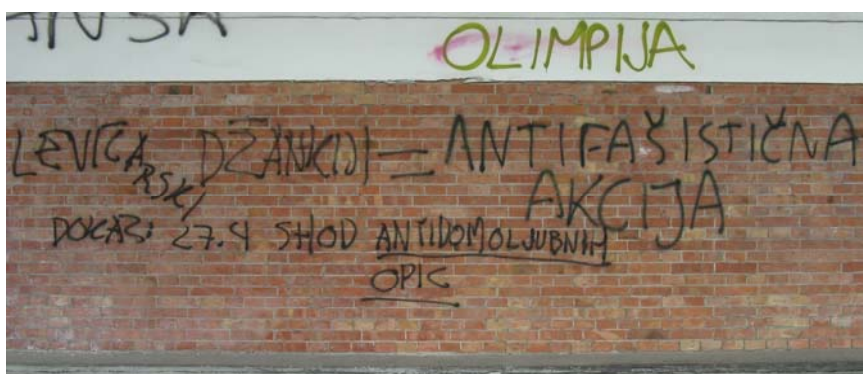
Slika 9.7: Primer konflikta med navijači in antifašisti

V času pred antifašistično manifestacijo se je pojavila grafitarska bitka tudi med navijači skupine Green dragons in antifašisti. O avtorjih, ki so bili vključeni v bitko, sem sklepala na podlagi lokacije in nasprotnojuočih si ideologij teh dveh skupin. Grafiti so se pojavili v bližini stadiona, kjer grafite ponavadi pišejo navijači, ki pa imajo med drugim tudi nacionalistična prepričanja. Na obzidju stadiona se je poleg starejšega napisa »OLIMPIJA« kot poziv na manifestacijo pojavil grafit »ANTIFAŠISTIČNA AKCIJA«, ki so mu navijači pripisali: »LEVIČARSKI DŽANKIJI = ANTIFAŠISTIČNA AKCIJA DOKAZ: 27. 4. SHOD ANTIDOMOLJUBNIH OPIC «.