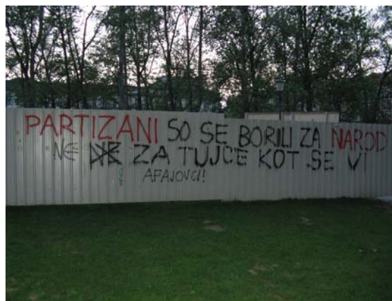
Slika 9.2: Grafitarški konflikt na Kongresnem trgu

V zadnjem času so bile aktualne bitke med antifašisti in nacionalisti, ko so se pred antifašistično manifestacijo Za svobodo sveta pojavili grafiti obeh skupin. Najprej so antifašisti z grafiti na Kongrasnem trgu pozivali ljudi, naj se pridružijo manifestaciji: »TRG OF 29. 4. OB 12 00 SMRT FAŠIZMU ZA SVOBODO SVETA«. Čez nekaj dni so se pojavili nacionalistični grafiti, ki so obtoževali antifašiste: »LEVA VLADA + TAJKUNI + ANTI – FA = FAŠIZEM«, »A – FA« (z rdeče-črno zvezdo) = »LEFTWINGED EXTREMISM« (z rdečo zvezdo, v kateri sta simbola srp in kladivo), »PARTIZANI SO SE BORILI ZA NAROD, NE ZA TUJCE KOT SE VI«. Vsebina grafitov kaže na dejstvo, da nacionalisti pripadnike antifašistov enačijo s fašisti in levičarskimi skrajneži.