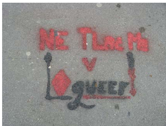
Slika 8.5: Grafit neformalne skupine Vstaja lesbosov na Kongresnem trgu

Lezbični grafiti, ki se v Ljubljani največkrat pojavljajo in imajo namen opozarjati, da je homoseksualnost normalna in si prizadevajo za vidnost lezbijk v javnem prostoru, so: »BITI GEJ JE O.K.«, »GEJ = OK«, »VSTAJA LESBOSOV«, simboli ♀♀, simbol dveh žensk v krilu, ki se držita za roke, »BILO KUDA LEZBE SVUDA«, »GEJI IN LEZBIJKE VAM ŽELIJO LEP DAN«, »LEZBIJKA TO JE PREZRITA PESEM«, »PINK PARTYZANKE!«, »NE TLAČ ME V ♦QUEER«.