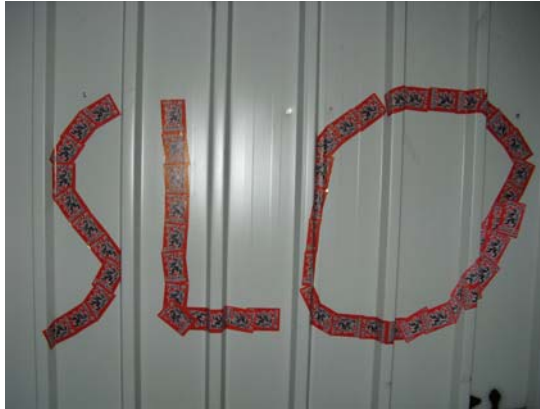
Slika 9.5: Grafit, narejen s pomočjo nalepk skupine Tukaj je Slovenija

Enemu grafitu pa so spet spremenili pomen: »PARTIZANI SO SE BORILI ZA NAROD, NE NE ZA TUJCE KOT SE VI AFAJEVCI«. Na grafit: »A – FA« (z rdečo-črno zvezdo) ≠ »LEFTWINGED EXTREMISM« (z rdečo zvezdo, v kateri sta simbola srp in kladivo) so prilepili še nalepke s simbolom karantanskega panterja in napisom »TUKAJ JE SLOVENIJA«, iz teh nalepk pa so oblikovali tudi besedo »SLO«.