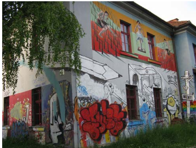
Slika 3.1: Umetniški grafiti v AKC Metelkova mesto