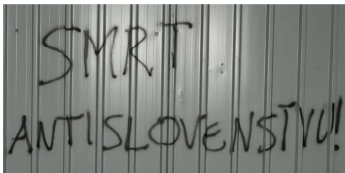
Slika 9.4: Nacionalistični grafit na Kongresnem trgu

Vendar na tej stopnji konflikta še ni bilo konec, saj so se spet pojavili nacionalistični kontragrafiti: »SMRT ANTISLOVENSTVU«, »FUCK |BLACK BLOC|« »GOOD NIGHT LEFT SIDE« in »SMASH LEFT TERROR«.