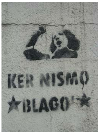
Slika 8.12: Grafit proti delavskemu izkoriščanju

IN KAPITALIZEM«, »KER NISMO BLAGO«, »ODJEBI KAPITALIZEM« in »SMASH THE CAPITALISM!!«.