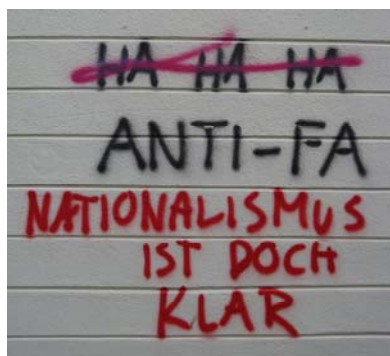
Slika 9.6: Grafitarska bitka na Trubarjevi cesti