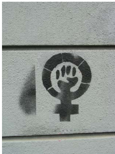
Slika 8.6: Grafit s feministično simboliko

DOWN, BREAK OUT«. Pojavil se je tudi simbolni grafit: stisnjena pest v simbolu planeta Venera, ki se uporablja tudi kot znak ženskega spola. Leta 2007, v dneh pred delavskimi demonstracijami, so se na ulicah pojavili grafiti s feministično vsebino: »FANTJE, KDO BO POMIL POSODO? JOŽI!«, »JEBEŠ VIŠJE PLAČE, ČE JE NIMAM – GOSPODINJA«, »AKTUALNO! TEČAJ GOSPODINJENJA ZA MOŠKE«. Pojavil se je tudi grafit, narejen s šablono, na katerem so v obliki prometnega znaka tri delavke z deklico, namesto moški z lopato kot na prometnem znaku »delo na cesti«, in napis: »17.11. DELAVKE NA CESTI«.