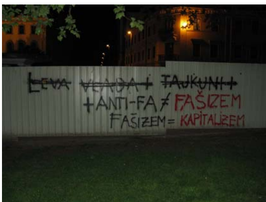
Slika 9.3: Rezultat grafitarske bitke med antifašisti in nacionalisti

Naslednji korak so naredili antifašisti, ki so grafite preoblikovali, da so dobili drugačen pomen: » LEVA VLADA + TAJKUNI + ANTI - FA ≠ FAŠIZEM« in dopisali »FAŠIZEM = KAPITALIZEM«, »PARTIZANI SO SE BORILI ZA NAROD, NE ZA TUJCE KOT SE VI«, »A - FA« (z rdeče-črno zvezdo) ≠ »LEFTWINGED EXTREMISM« (z rdečo zvezdo, v kateri sta simbola srp in kladivo). Slednji grafit so polepili še s propagandnimi nalepkami z napisi: »ANTIFA CONA SMRT FAŠIZMU«, »TUKAJ NI PROSTORA ZA SEKSIZEM SMRT FAŠIZMU«.