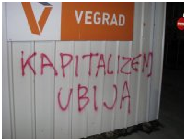
Slika 8.2: Primer anarhističnega grafita proti kapitalizmu

»KAPITALIZEM UBIJA!«, »KOLIKO »NESREČ« ŠE?« in »VEGRAD=MORILCI«, kar se je nanašalo na nedavno smrt 25-letnega delavca na Vegradovem gradbišču. Pred stavbo Univerze v Ljubljani so aktivisti napisali »ZNANJE NI BLAGO!« in »ZASEDIMO UNIVERZE!«. Pred vhodom grškega veleposlaništva so napisali »WE ARE ALL ALEXANDROS!« in »COPS - OFF THE STREETS!«. Na koncu akcije so pred španskim veleposlaništvom pred vhod napisali »FREE ALL POLITICAL PRISONERS!«, s tem pa izkazali solidarnost španskim anarhistom, ki so jih oblasti aretirale, medtem ko so izražali podporo grškim somišljenikom. Ta protest najbolje prikaže, kako posamezniki sodelujejo z različnimi družbenimi skupinami in skupaj izražajo ideologijo in prepričanja, ki je v nasprotju z ideologijo oblasti. V tem primeru so se združili predstavniki anarhistov, študentov in aktivistov, ki se borijo za pravice vseh prekernih 6 , ki so skupaj izkazali solidarnost z grškimi somišljeniki.