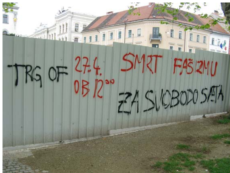
Slika 3.3: Politični grafit na Kongresnem trgu

kulturo, zato pa se jim tudi ne zdi sporno, da se pojavljajo na ulicah. Kot meni Hrastarjeva (1992) so »risbe redkeje problematične vsebine, tako da bi jih, vsaj načeloma, brisalci grafitov morali pustiti nedotaknjene«. Z institucionalizacijo umetniških grafitov pa grafiti iz ilegalne sfere prestopijo v legalno, kjer je grafitarjem dovoljeno izražanje, pokažejo lahko svoj talent širšim množicam, grafiti pa so kvalitetnejši, saj jih nihče ne preganja med delom, ker ne kršijo zakona. Med grafitarji obstajajo neka nenapisana pravila, ki jih upošteva večina grafitarjev. Mednje spada tudi pravilo, da naj se čez grafite drugih avtorjev ne bi pisalo, kar v večini primerov umetniških grafitov drži, na področju političnih grafitov pa večkrat prihaja do konfliktov med različnimi skupinami. V Ljubljani so znani primeri, ko se nenehno pojavljajo grafitarski konflikti med anarhisti in nacionalisti, navijači različnih nogometnih klubov, antifašisti in nacionalisti, kar pa bom podrobneje opisala in razložila v nadaljevanju.