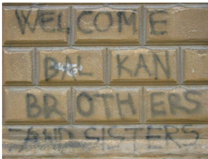
Slika 8.1: Protiksenofoben grafit na Maistrovi ulici

Kot odgovor na nacionalistične grafiti so se v Ljubljani pojavili protiksenofobni grafiti: »TUKAJ JE STRAH«, »BUREK BI, DŽAMIJE PA NE BI!«, »TO JE NOROST« in »WELCOME BALKAN BROTHERS AND SISTERS«.