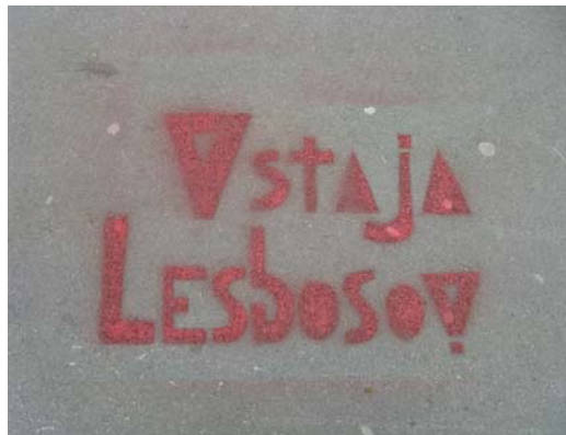
Slika 8.4: Najbolj značilen grafit neformalne skupine Vstaja lesbosov

Homoseksualnost se v medijskem diskurzu obravnava stereotipno in je večinoma reprezentirana kot »drugačna«, »marginalna« in »obrobna«. Grafiti lezbijkam omogočajo, da izven okvirov stereotipizacije poskušajo vplivati na javno mnenje, spreminjajo predsodke o lezbijkah in se borijo za vidnost lezbijk v javnem prostoru.