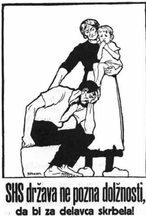
Slika 5.5: Letak avstrijske propagande 1

V nasprotju z jugoslovansko propagando, ki je poudarjala slabo ekonomsko stanje Avstrije, so podobe avstrijske propagande ponavljale, da mora Koroška ostati v enem kosu znotraj Avstrije, saj bi cona A ekonomsko propadla brez centrov Koroške, kot sta Celovec in Beljak. Koroška kot del Avstrije je bila predstavljena kot boljše situirana, kot če bi bila del Jugoslavije. Novo državo so avstrijski agitatorji prikazovali kot poljedelsko državo, kjer bodo koroški industrijski delavci zanemarjeni. Plebiscitna kampanja se je tako obrnila neposredno na koroške delavce, trgovce in obrtnike in jih svarila pred ekonomskimi posledicami odločitve ob plebiscitu. Slika 5.5 prikazuje zaskrbljenega koroškega delavca, ki ne poskrbi za svojo družino zaradi nove Države SHS, ki mu ne priskrbi dela. Delavec je tako potisnjen v bedo ali pa jih bo sedaj morala podpirati žena (Pušnik 2006, 68).