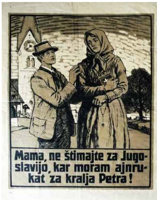
Slika 5.6: Letak avstrijske propagande 2

Veliko koroških žena in mater se je lahko poistovetilo z žensko na plakatu. Podoba je koroškim materam sporočala, da bodo morali njihovi sinovi služiti vojsko v daljnih krajih po Jugoslaviji. In če ta voli za Jugoslavijo, bo sama obsodila svojega otroka na takšno usodo.