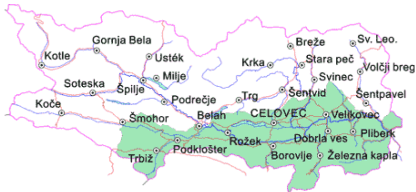
Slika 3.1: Koroška pred germanizacijo, zeleno območje s 95 odstotki Slovencev

dvakrat toliko (38.948). Po teh podatkih se je do leta 1910 več kot dvotretjinska večina slovenskega jezika skrčila v manjšino. Zanimivo je tudi, da so na ozemlju poznejše plebiscitne cone A našli 50.873 oseb s slovenskim (69,18 %) in 22.651 oseb (30,82 %) z nemškim občevelnim jezikom.