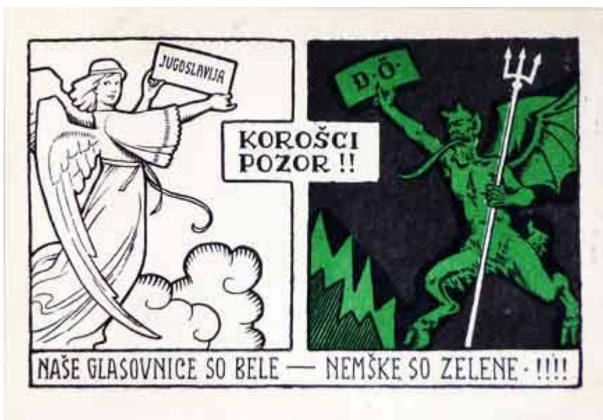
Slika 5.1: Letak jugoslovanske propagande 1

En izmed temeljnih izpostavljenih problemov jugoslovanske propagande je bil odnos med staro Avstrijo in novo Jugoslavijo. Ta podoba se je najpogosteje ustvarjala prek igre z barvami, saj so bili volilni lističi, ki so volili za Jugoslavijo, beli, za Avstrijo pa zeleni. Belina je predstavljala jugoslovanstvo in slovenstvo in je prinašala pomene svežine, mladosti, nedolžnosti in miline. Belo-zelene podobe so preplavile Koroško in so veljale kot nasprotja med Slovenci in Avstrijci (Pušnik 2006, 61).