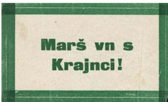
Slika 5.4: Plebiscitna nalepka