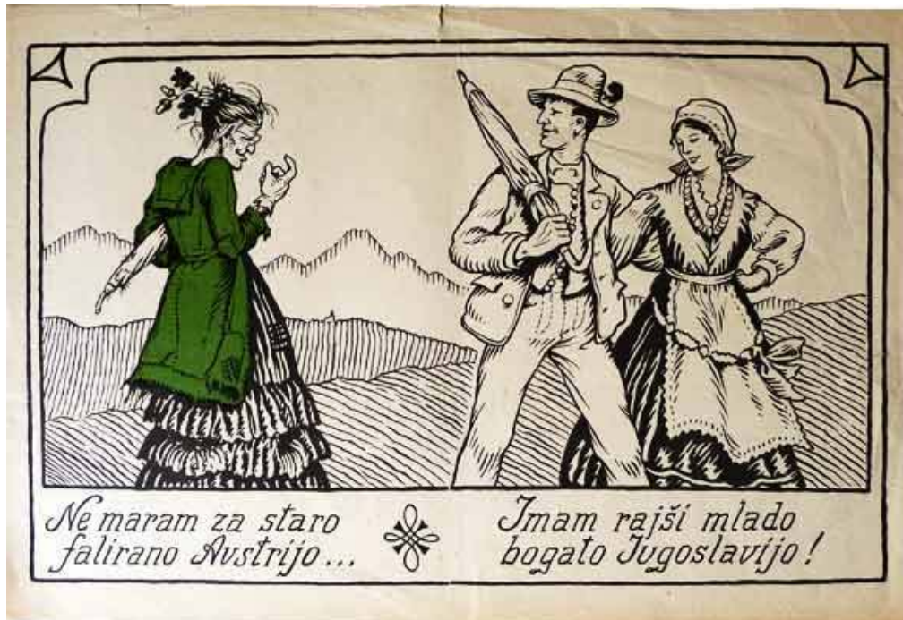
Slika 5.2: Letak jugoslovanske propagande 2