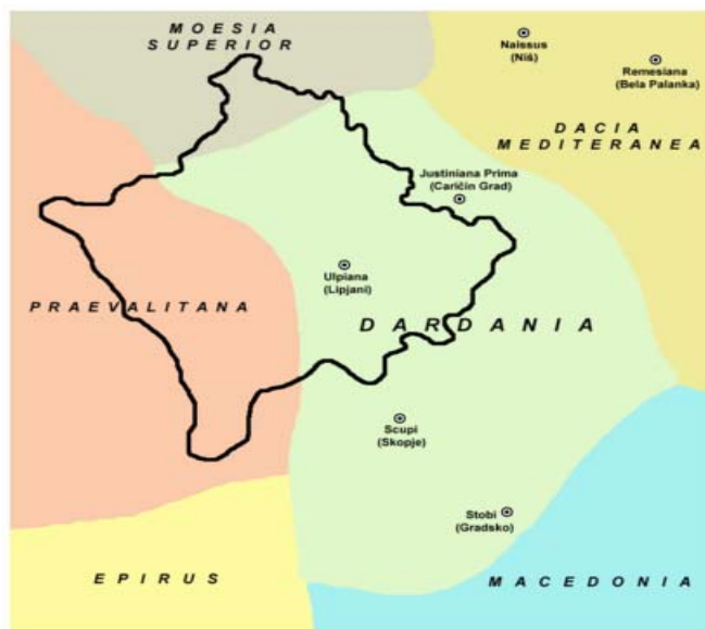
Kosovo within Byzantine Empire (6th century):