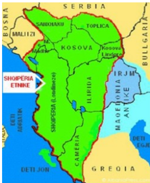
Slika 5.2: Eden od zemljevidov Velike Albanije

stoletja, ko je bila ustanovljena “Prizrenska liga”, ki jo bomo obravnavali v nadaljevanju. Po balkanskih vojnah, ki so trajale od 1912 do 1913, je bilo Kosovo razdeljeno med Črno Goro in Srbijo, slednja pa je zasedla tudi znaten del Makedonije. Z londonskim sporazumom je bila ustanovljena “majhna Albanija”, ki je sicer v dobršni meri obsegala ozemlje današnje Albanije, a precejšen del Albancev je ostal zunaj meja te novoustanovljene države (Derens in Geslin 2006).