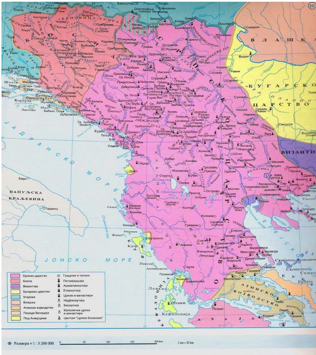
Slika 4.2: Največji obseg srbskega imperija ob koncu vladavine Stefana Dušana leta 1355.