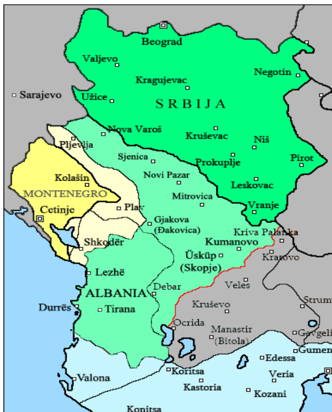
Slika 4.4: srbske in črnogorske ozemeljske pridobitve leta 1912.

za Albance katastrofalne posledice, saj so bili Srbi podžgani z zgodbami o grozodejstvih, ki so jih bili deležni kristjani za časa nemirov na albanskih ozemljih, zaradi česar so se na najbolj surove načine znašali nad nemočnimi albanskimi vasmi (Glenny 2001, 227-233).