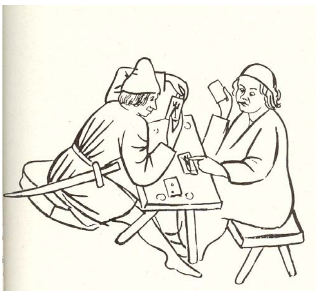
Slika 3.3: Kvartopirca (risba M. Tršarja po freski kroga Janeza Ljubljanskega v Crngrobu)

Freska »Sv. Nedelja« iz okrog 1460, ki na zunanji strani cerkvice v Crngrobu opozarja na prepovedana nedeljska opravila, prikazuje tudi dva zagreta kvartopirca pri igri s »hudičevimi pidlki«.