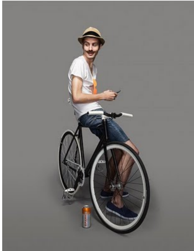
Slika 2.2: Ironični brki, klobuk, bela majica in kolo: prepoznavni simboli hipsterja