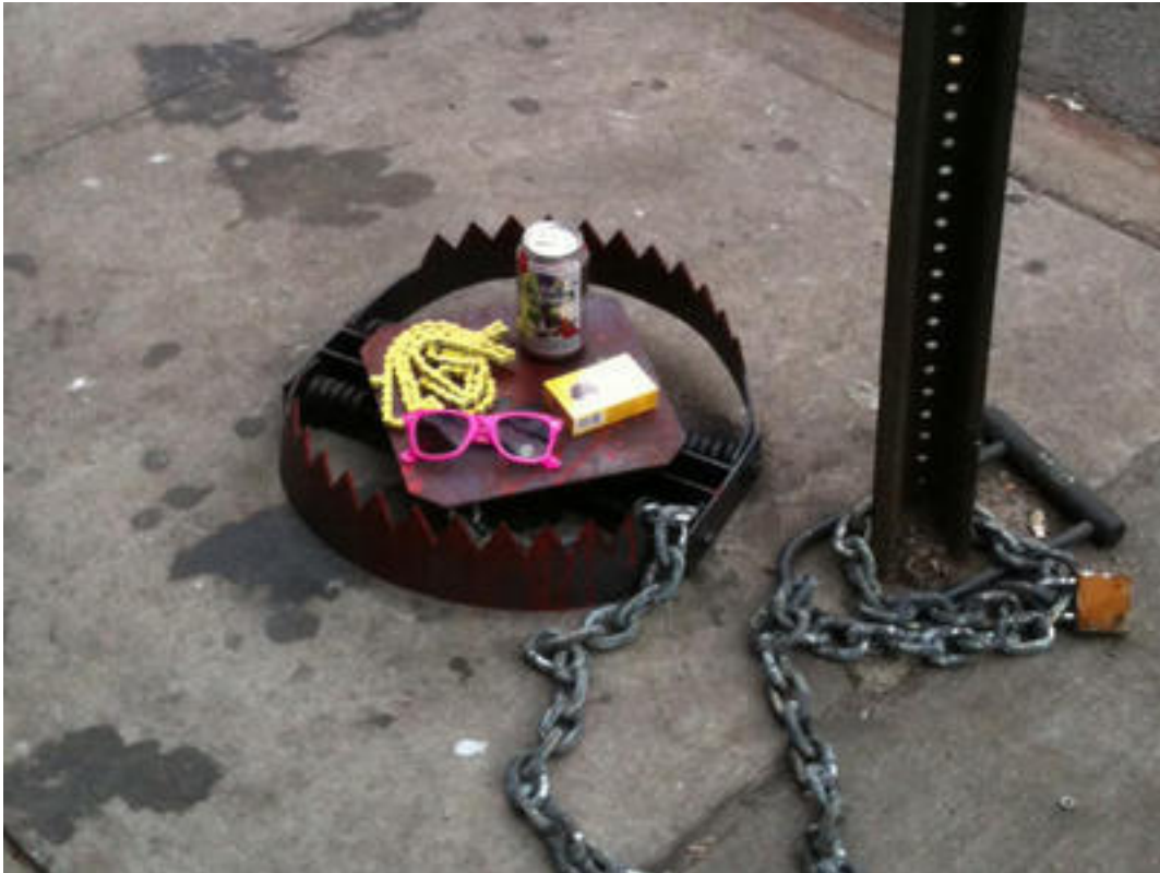
Slika 2.3: Hipsterska past na ulicah New Yorka