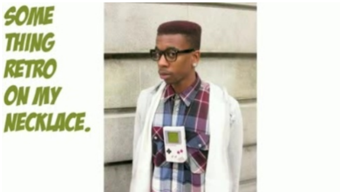
Slika 2.7: Slika iz videoposnetka Being A Dickhead's Cool