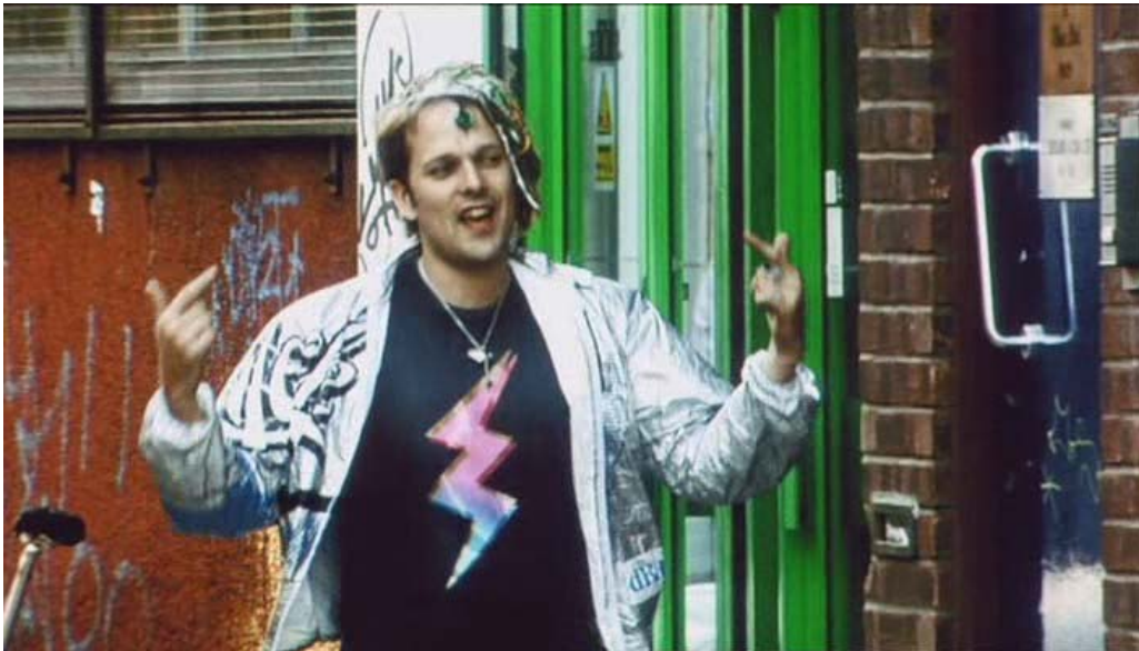
Slika 2.6: Nathan Barley

Na televiziji in internetu z lahkoto najdemo veliko parodij na hipsterje. Izpostavila bom le dva primera. V dveh televizijskih serijah, ki se ne predvajata na slovenski televiziji, Portlandia in Nathan Barley, je hipster predstavljen skozi pretirano absurdnostno predstavitvijo njihovega življenjskega okolja, ki je ključen za njihovo identiteto (najljubši sta jim mesti Portland v ZDA in London v Veliki Britaniji). Kulturna situacijska satira Nathan Barley se osredotoči na odnos postaranega, veliko bolj pristnega hipsterja do novega vala hipsterskega trga (glej Sliko 2-6).