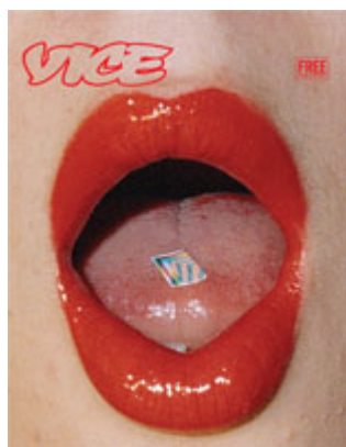
Slika 2.5: Naslovnica revije Vice

Ljubitelji apatije in ironije so povezani/se povezujejo preko blogov in kupujejo v trgovinah, ki še pospešujejo modno/stilsko informiranje (Haddow 2008). Na blogih zvesto pišejo o svojem vsakdanu, listajo novodobne revije, kot so Vice (Slika 2-5), Another Magazine in Wallpaper (Haddow 2008). Ker so dokaj ustvarjalna in umetniška bitja, se zanimajo za glasbo, literaturo in filme.