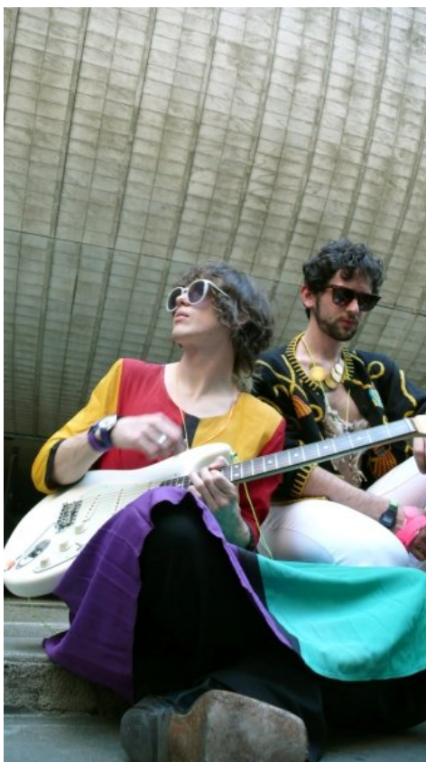
Slika 2.4: Skupina MGMT