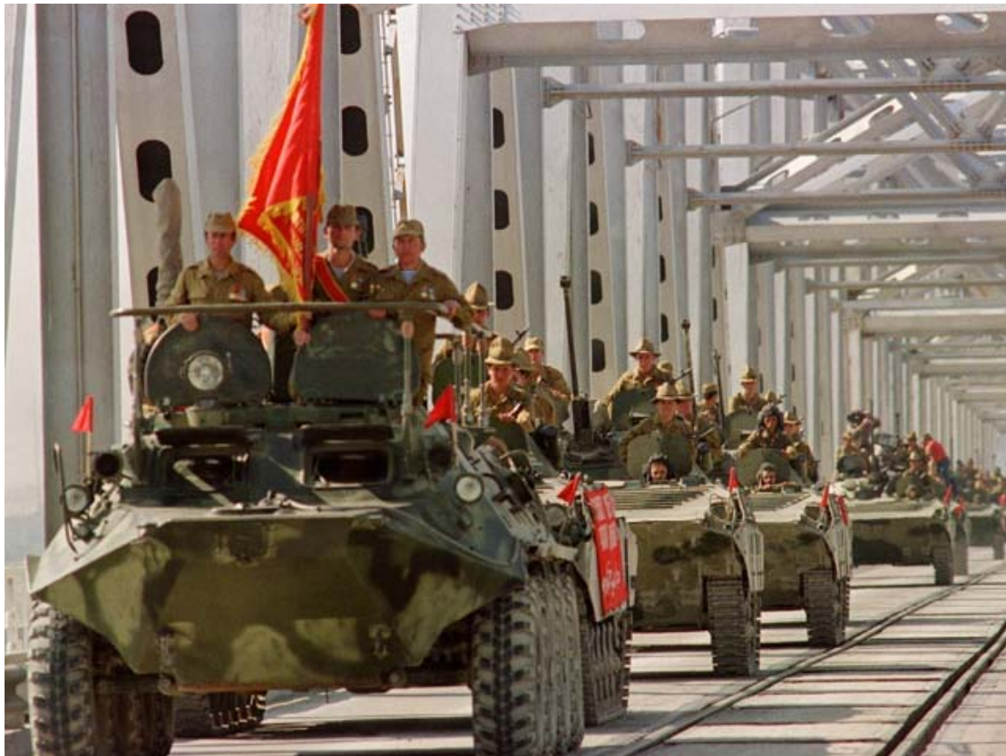
Slika 4: Sovjetske enote se umikajo iz Afganistana 136 .

V zadnji fazi vojne (januar 1987 – februar 1989), sovjetska armada ni več izvajala ofenzivnih akcij proti mudžahedinom, ampak se je zadovoljila z obrambnimi akcijami proti upornikom, ki bi omogočile miren umik enotam na teritorij SZ. 8. februarja je Gorbačov sovjetski javnosti sporočil svojo odločitev o umiku sovjetskih enot iz Afganistana 134 . Zadnje sovjetske enote pa so prečkale most miru 15. februarja 1989 135 . DLRA, pod vodstvom Mohammada Najibullaha, ki je zamenjal Kamrala novembra 1986, se je na oblasti obdržala do leta 1992. Ob razpadu SZ je prenehala tudi pomoč režimu v Kabulu. Leta 1992 so mudžahedini zavzeli Kabul in vladali Afganistanu do leta 1996, ko na oblast, po še eni državljanski vojni, pridejo talibani. Talibani pa se obdržijo na oblasti vse do ameriške vojaške intervencije oktobra leta 2001.