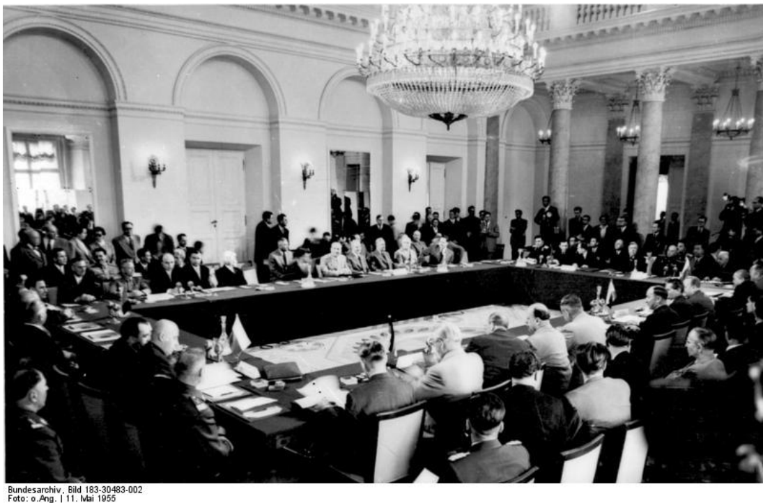
Slika 1: Konferenca komunističnih držav o ustanovitvi Varšavske zveze 63 .

imel pod nadzorom mednacionalne vojaške enote zveze. Združeno poveljstvo oboroženih sil je imelo sedež v Varšavi, čeprav je bil glavni štab Varšavske zveze v Moskvi. Vrhovni poveljnik zveze je bil obenem namestnik obrambnega ministra Sovjetske zveze. Vodja združenega poveljstva zveze pa je bil obenem namestnik vrhovnega poveljstva obrambnih sil Sovjetske zveze. To dokazuje, da je Sovjetska zveza imela dominanten položaj v zvezi, prav tako kot so imele ZDA v zvezi NATO.