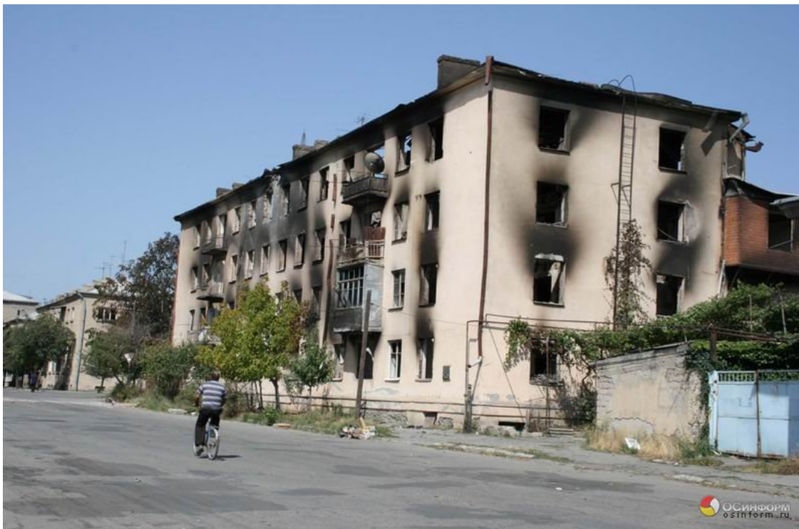
Slika 5: Stanovanjska hiša v Tsinhvaliju, po gruzijskem bombardiranju 197 .

točk, s katerim bi se končali boji med gruzijskimi enotami na eni strani in rusko-osetijskimi ter abhazijskimi enotami na drugi strani. Čeprav je premirje bilo podpisano že isti dan, so boji trajali še do 16. avgusta 194 . Plan so nato podpisali predsedniki Gruzije Mihail Sakašvili, Rusije Dmitri Medvedev, Južne Osetije Eduard Kokoiti in Abhazije Sergej Bagapš. Iz Južne Osetije je bilo v Severno Osetijo prisiljeno pobegniti cca. 30.000 civilistov, oblasti v Tsinhvaliju pa so potrdile še 365 civilnih žrtev v vojni. V vojni je življenje izgubilo 250 vojakov Južne Osetije, 15 je bilo pogrešanih, 500 pa jih je bilo ranjenih, medtem ko je ruska armada priznala 49 žrtev, 10 pogrešanih vojakov in 265 ranjenih 195 . Rezultat vojne je neodvisnost Južne Osetije in Abhazije. Prva jo je priznala Rusija 26. avgusta 2008 196 , sledile pa so ji še Nikaragva, Venezuela in mali pacifiški otok Nauru.