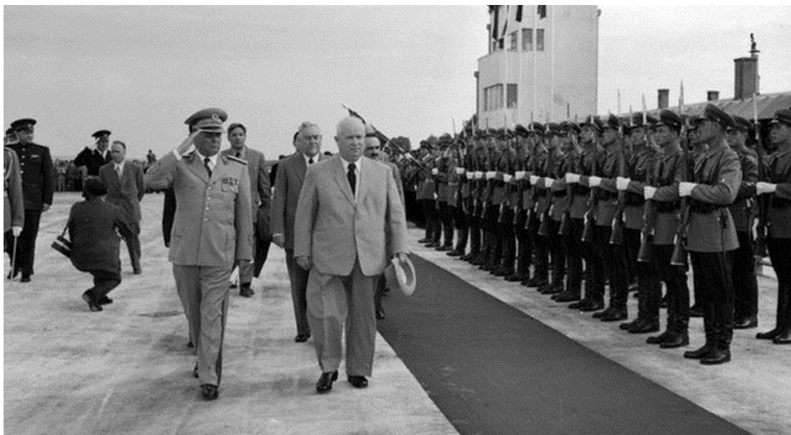
Slika 3: Tito in Hruščov na letališču v Beogradu 76 .