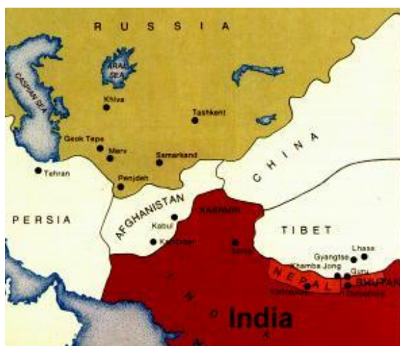
Slika 3.2: Zemljevid Afganistana ob razmejitvi z Durandovo mejno črto