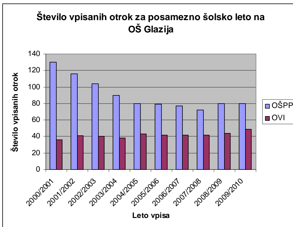
Shema 6.1: Število vpisanih otrok za posamezno šolsko leto na Osnovni šoli Glazija

Osnovna šola Glazija v Celju se je od šolskega leta 2000/2001 do vključno šolskega leta 2007/2008 ukvarjala s problematiko naraščajočega upadanja vpisa otrok. V šolskem letu 2000/2001 je bilo vseh otrok, ki so bili vpisani na to šolo kar 166, od tega jih je obiskovalo prilagojen program z nižjim izobrazbenim standardom 130, 36 pa jih je bilo vključenih v vzgojne skupine (glej Tabela 6.4). Vedno večji upad vpisa je bil do šolskega leta 2008/2009, ko je šola po dolgem času ponovno »doživela« porast vpisa otrok s posebnimi potrebami. V šolskem letu 2008/2009 je bilo na Osnovni šoli Glazija v prilagojen program vpisanih 80 učencev, posebni program pa je obiskovalo 44 oseb. V tem šolskem letu je prav tako 80 učencev vpisanih v prilagojen program, kar 49 oseb pa obiskuje posebni program (glej Tabela 6.4 in Shema 6.1).