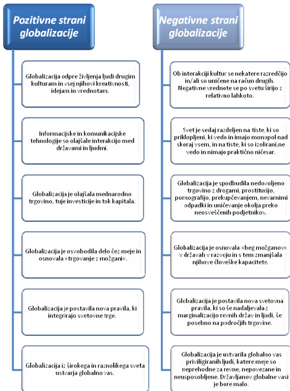
Tabela 5.1: Pozitivne in negativne strani globalizacije