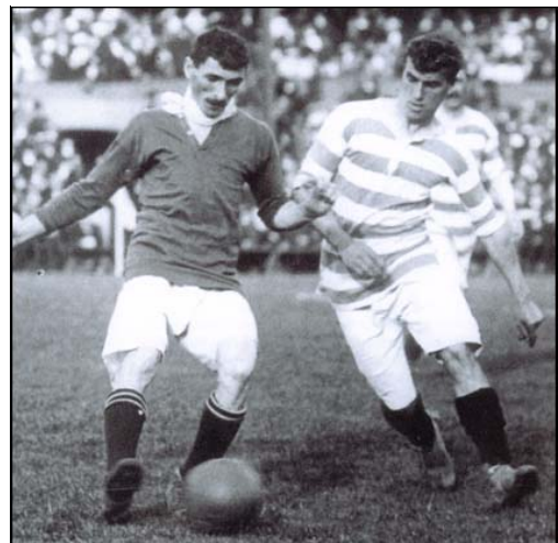
Vir: For the Good of the Game (1998).