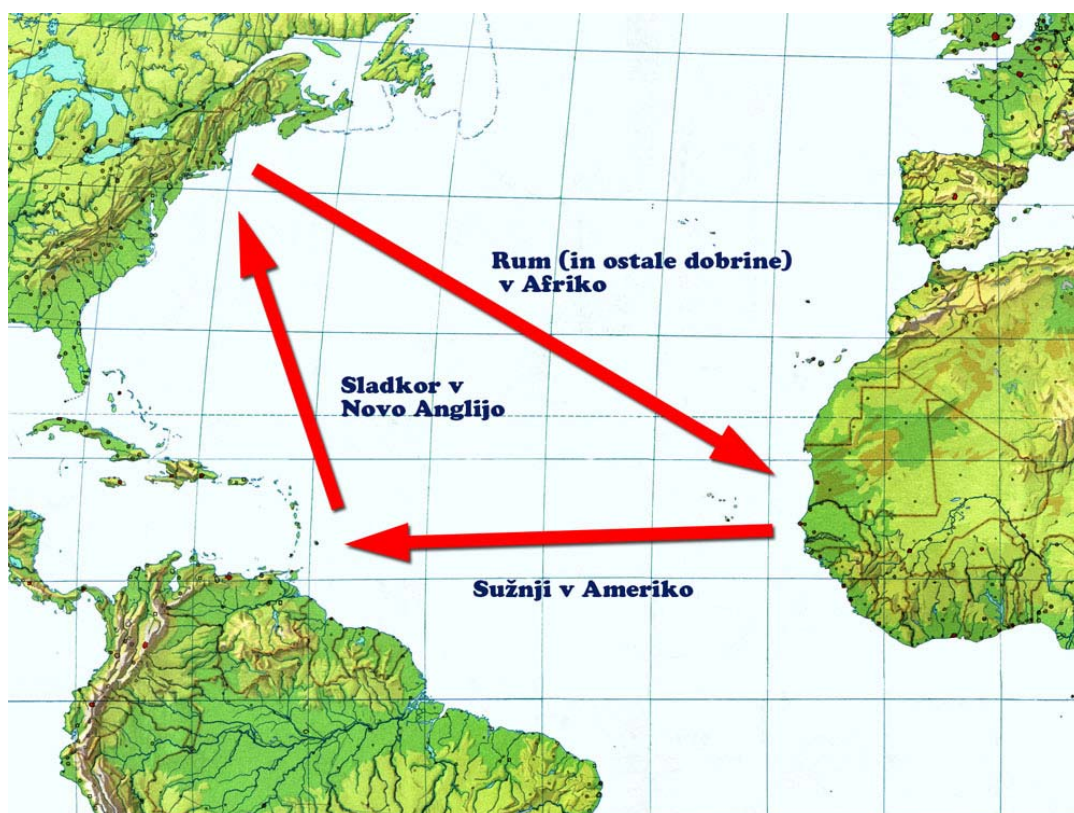
Slika 4.1: Trikotna pot trgovanja