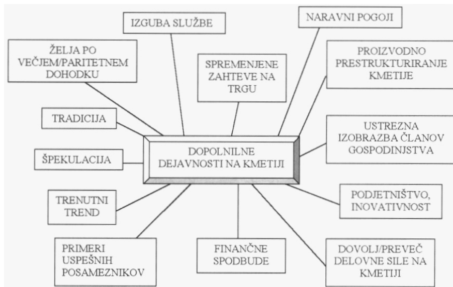
Shema 1.1: Vzroki za razvoj dopolnilnih dejavnosti

Vir: POTOČNIK, IRMA (2002): »Geografski vidiki dopolnilnih dejavnosti na slovenskih kmetijah«. Sodobno kmetijstvo , l. 35, št. 2, str. 84.