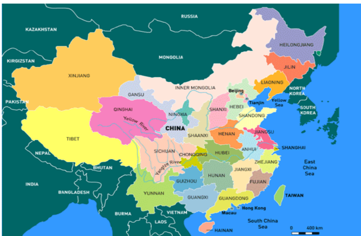
Slika 2.1: Administrativna razdelitev