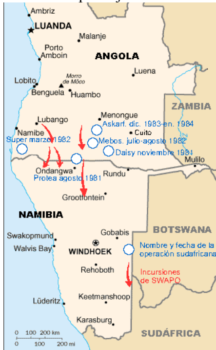
Slika 4.5: Operacije JAR in SWAPO 1981 - 1985

še istega leta napadla ključne elemente angolske protizračne obrambe (operacija »Protea«). (Ant's Military Notes) (glej Sliko 4.5)