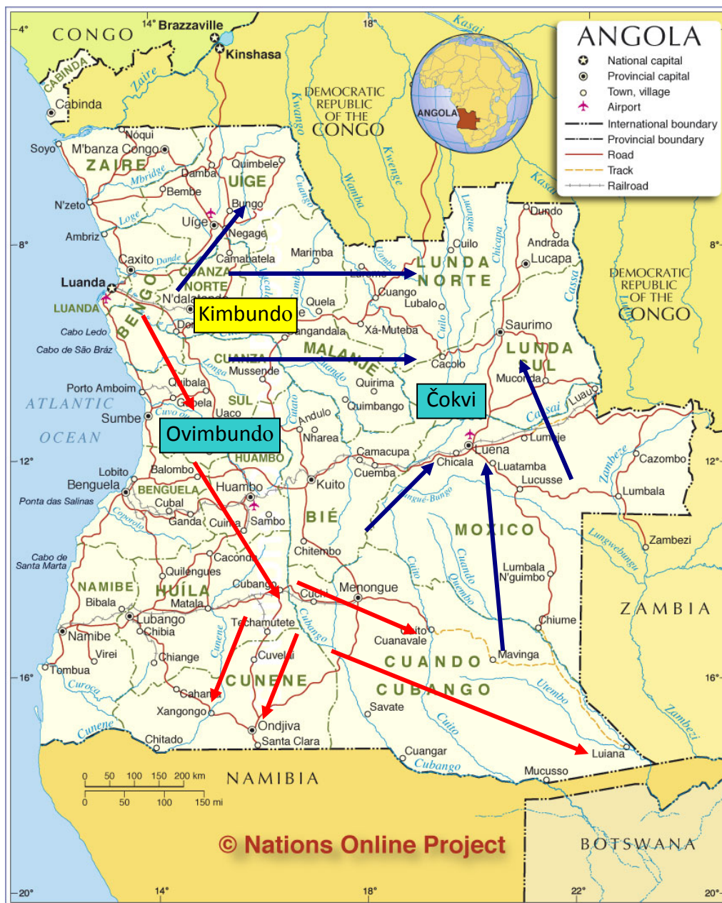
Slika 4.3: Province 4