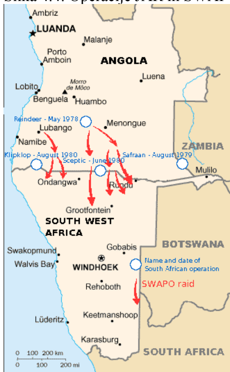
Slika 4.4: Operacije JAR in SWAPO 1978 - 1980