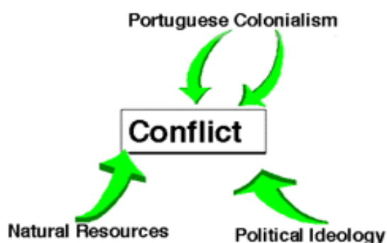
Slika 4.1: Vzroki za državljansko vojno

Leta 1961 se je v Angoli začela osamosvojitvena vojna, ki se je 14 let kasneje sprevrgla v državljansko vojno, za kar je bila poleg portugalske kolonizacije v veliki meri odgovorna tudi njena kasnejša kaotična dekolonizacija. (MacQueen 2002, 124) Vojna je že takoj na začetku spremenila svoj značaj, postala je del hladne vojne in s tem povezana z nasprotji med obema velesilama in njunima ideologijama, ZDA in SZ. (glej Sliko 4.1) Kot podpornice političnih gibanj so zunanji akterji izključno zaradi lastnih koristi (koriščenje angolskih naravnih virov) do konca hladne vojne leta 1991 krojil potek državljanske vojne. (De Waal 2004, 20-21) SZ, Kuba in portugalski komunisti so podpirali komunistično MPLA, medtem ko sta FNLA in UNITA uživali podporo JAR, ZDA, Zaira in Kitajske. S prenehanjem obstoja SZ (1991) in bližanju konca apartheida v JAR se državljanska vojna v Angoli vseeno ni končala. Za nadaljevanje spopadov je zato potrebno poiskati nove vzroke, značilne predvsem za spore znotraj afriške celine.