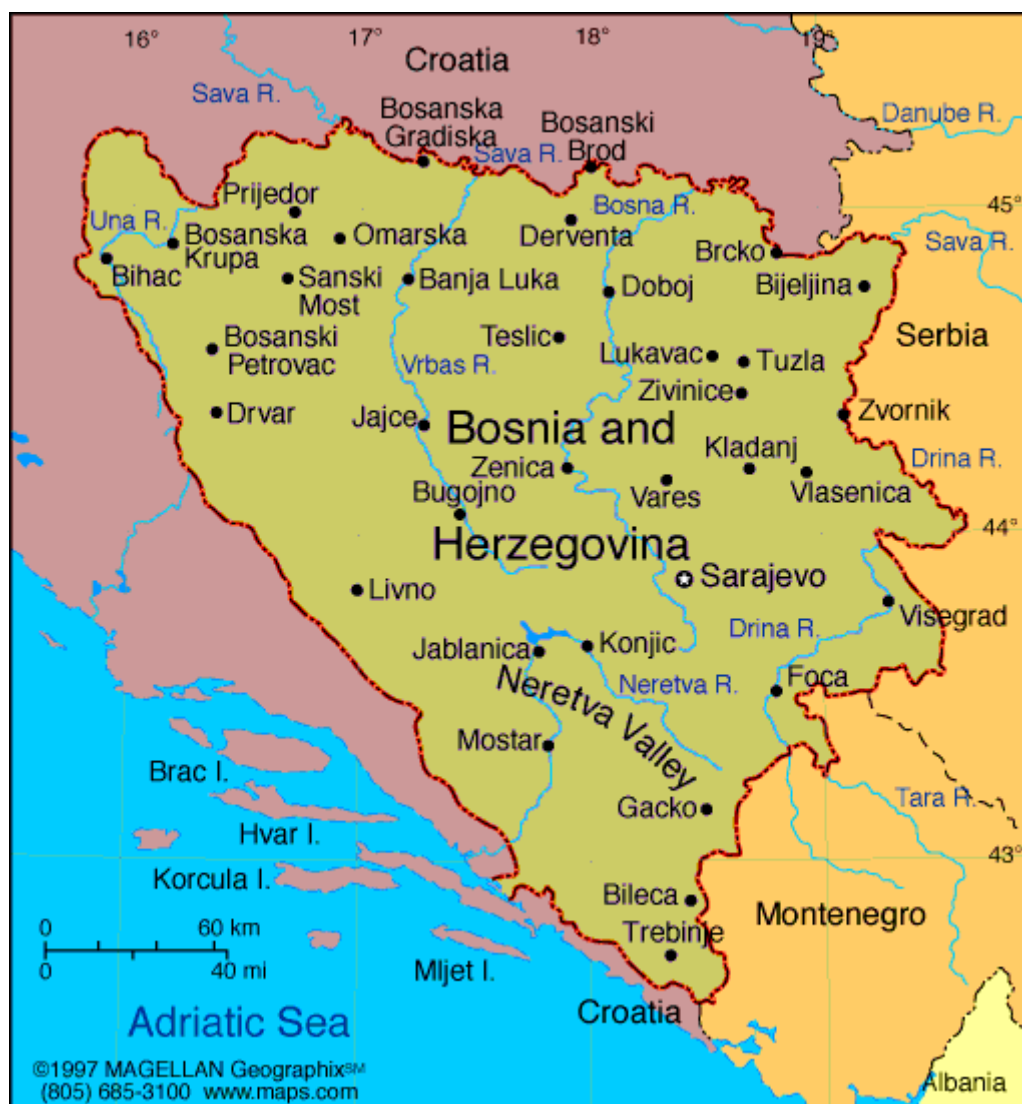
Slika 6.1: Zemljevid Bosne in Hercegovine