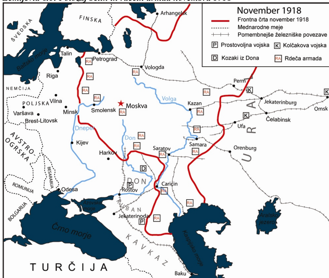
Zemljevid 6.1: Položaj belih in rdečih armad novembra 1918