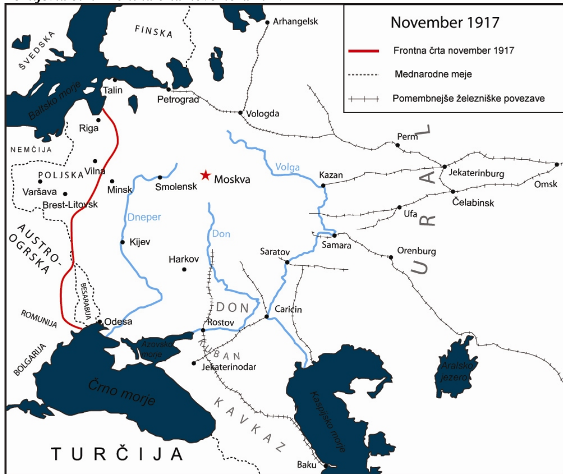
Zemljevid 5.1: Frontna črta novembra 1917