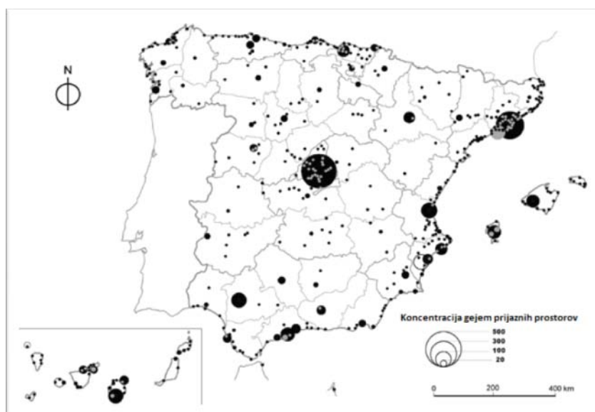
Slika 5.1: Zgoščenost gejevskih prostorov v Španiji leta 2005

Na primer, razen prostitucije ni veliko poklicev in služb, ki bi ženskim transseksualkam omogočale normalno življenje. Ogromno je primerov, ko mora posameznik svojo spolno usmerjenost skrivati, da bi se izognil problemov na delovnem mestu, v svoji soseski, družini ali šoli svojih otrok, na primer. Sicer obstajajo protidiskriminatorne pisarne, kjer se lahko pritožijo, ampak načeloma brez resnih posledic za kršitelje. Vsako leto se zgodi kakšen resen napad na LGBT populacijo, in CGB, kjer delam, ima uspešno protiagresijsko delavnico, ki pomaga ljudem pri zavarovanju pred možnimi napadi. V cruising območjih je ogromno agresije, ki pa ostaja neprijavljena (Xavi).