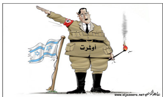
Slika 5.1: Primerjava Izraelcev z Nacisti: predsednik Olmert prikazan kot Hitler

Tako imenovane »nove nacist« ponazarjajo z znakom svastike in predvajajo risanke, v katerih nastopa predsednik vlade Ehud Olmert, ki je oblečen v nacistično uniformo s salutiranjem (glej sliko 5.1).