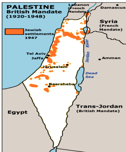
Slika 4.1: Ozemlje pred osamosvojitvijo Izraela

Začetki Izraelsko-Palestinskega konflikta segajo v leto 1947, ko se je končal mandat Velike Britanije, ki je upravljala s Palestinskim ozemljem od leta 1920. Palestinsko ozemlje je bilo sestavni del Otomanskega imperija, ki je propadlo s prvo svetovno vojno in začelo se je britansko mandatno upravljanje (glej sliko 4.1). Britanci so izdali Balfourjevo 3 deklaracijo, ki je s pismom judovskim voditeljem v Veliki Britaniji obljubila Judom pravico do svojega ozemlja, kar je pomenilo prvo politično priznanje njihovih ciljev. V času druge svetovne vojne pa je tajna britanska diplomacija tudi Arabcem obljubila številna ozemlja v zameno v boju proti Turkom (Požun 2004, 21).