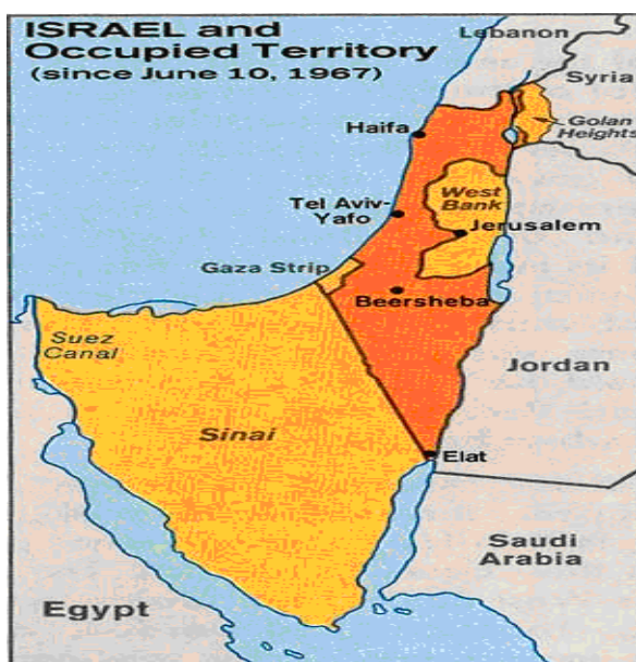
Slika 4.2: Ozemlje po vojni leta 1967

Izrael zasede Galilejo, puščavo Negev in obalo Sredozemskega morja. Jordanija je zasedla Zahodni breg, Egipt Gazo, Jeruzalem je razdeljen na vzhodni jordanski del in zahodni izraelski. V novi vojni leta 1956 je Izrael v napadu na Egipt pridobil Sinajski polotok. Sledijo novi incidenti na mejah Izraela s Sirijo, Jordanijo in Egiptom. Zaradi premika egiptovskih enot in kršenje določb mirovnega sporazuma je Izrael leta 1967 ponovno napadel prej omenjene države. Izrael je osvojil Zahodni breg, Gazo, Sinajski polotok, Golansko planoto ter priključil vzhodni del Jeruzalema (Nikolič 2002, 33–42), glej sliko 4.2.