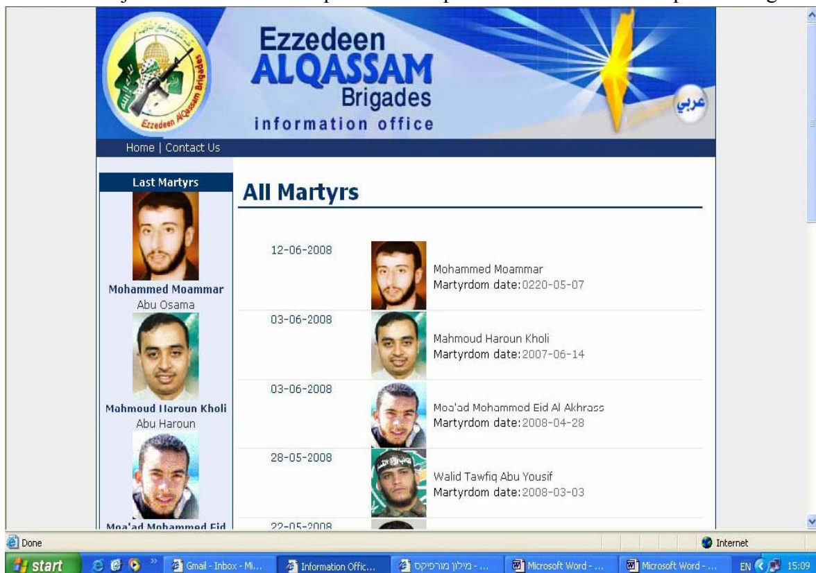
Slika 5.3: Objava samomorilskih napadalcev na spletni strani Ezzedeem Alqassam Brigades

V juniju 2008 so bile zgoraj omenjene strani posodobljene, poleg avdio in video izboljšav ponujajo pregled statistični podatkov o količini zapornikov, izraelskih žrtvah in terorističnih oz. samomorilskih napadih, biografske in glasbene objave, ki častijo in povečujejo vse »nove« samomorilce. Spodnja slika na spletni strani Alqassam Brigades, prikazuje slike in datume samomorilskih akcij (glej sliko 5.3).