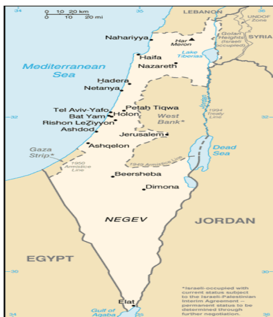
Slika 4.3: Današnje območje Izraela, Zahodnega brega in Gaze