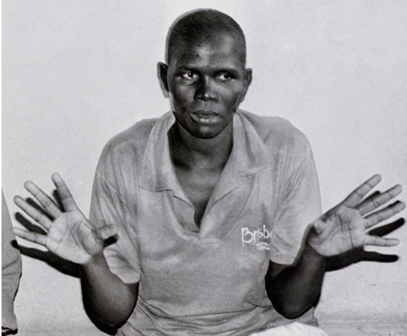
Slika 2: Alice Lakwena