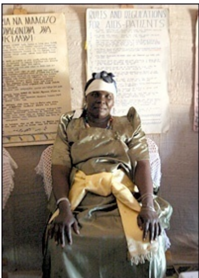
Slika 3: Alice Lakwena v kenijskem begunskem taborišču