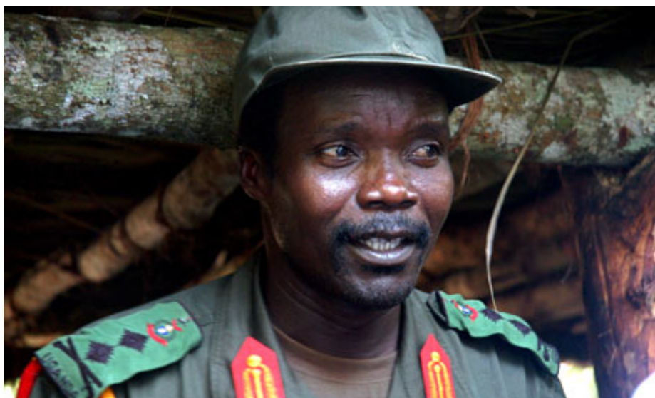
Slika 1: Joseph Kony