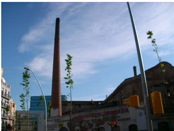
Slika 7.3: Dimnik v Poblenou.

Tako lahko rečemo, da so prav ti nezahtevni izrastki odličen primer ohranjanja kulturne dediščine brez, da bi za to kompromitirali moderno kapitalsko logiko, prevelikega zapravljanja ali ovirali visokoleteče urbanistične načrte. Če izhajamo, da je najčistejša vloga kulturne dediščine moralna, lahko dimniki odlično opravijo svojo vlogo z relativno malo napora.