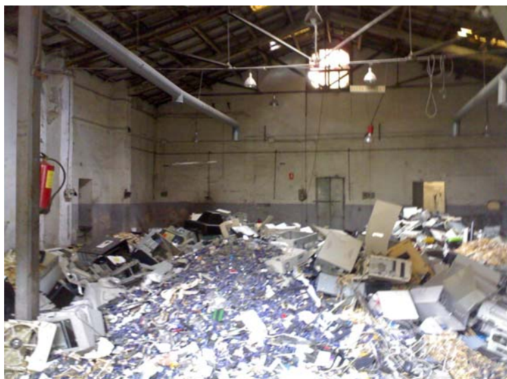
Slika 7.2: Hangar, razstavni prostor.

Nahaja se na 1800 kvadratnih metrih, v industrijskem delu Poblenou-a na ulici Passatge del Marques de Santa Isabel. Sestavljen iz 15 individualnih studiev, medijskega laboratorija in dveh filmskih prizorišč. Na svoji spletni strani navajajo, da se nahaja v prenovljenih industrijskih prostorih, kar ni primerna oznaka za razpadajoče stavbe, ki jo označujejo. Obnovljeni so minimalno, na prvi pogled celotno poslopje zгледа popolnoma zapuščeno. Njihovo delovanje na drugi strani pa je živo. Sodelujejo z mnogimi umetniki in raziskovalci in celega sveta. Vendar v pogledu kulturne dediščine z vidika poslopij ne prinašajo veliko, glede na to, da so obnovljene minimalno. V smislu inovacij in kulturnega razvoja pa so zelo dejavni. Če Hangar za trenutek primerjam z Metelkovo bi lahko potegnili pavšalen zaključek da prostori, ki so nabiti z ustvarjalnostjo ne dajo veliko na zunanji zglede. Bolj verjetno, pa je to povezano s financiranjem. Katalonska vlada in Barcelonski parlament prispevata denar, ki je namenjen osnovnemu delovanju in posameznim projektom umetnikov. Za obnovo celotne stavbe, so se odločili da je to zalogaj, ki se ne izide z ekonomskim napredkom. Kar več kot očitno ni bil problem nasproti stoječe popolnoma obnovljene policijske stavbe, ki je prav tako del industrijske kulturne dediščine, o kateri bomo več povedali v nadaljevanju.