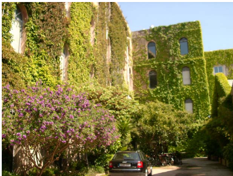
Slika 7.1: Palo Alto.

Celoten objekt deluje zelo odrezano od ostalega dela, ki je opazno bolj zapuščen. Vendar sem na vprašanje, če imajo kakšno varnostno službo, ki varuje objekt, dobila negativen odgovor. Kar je v popolnem nasprotju z splošnim vtisom o soseški, ko lahko skoraj na vsaki bolj obnovljeni stavbi znak ki opozarja, da je okolica pod video nadzorom in pod okriljem ene izmed varnostnih služb. Notranjost dvorišča se sicer zaklepa in tako jasno nakazuje nepovezanost prostora z okolico. Deluje kot samozadostni otok. Bolj ironično kot resno, imajo celo svoj zelenjavni vrt, kar je sredi urbaniziranega Poblenu-a redkost. Kot pravi Evans, fizična bližina še ne pomeni premagovanje socialne in kulturne izključenosti (Evans 2001, 2). Vendar se v tem primeru kažejo težnje po tesnejši simbiozi z neposredno okolico.