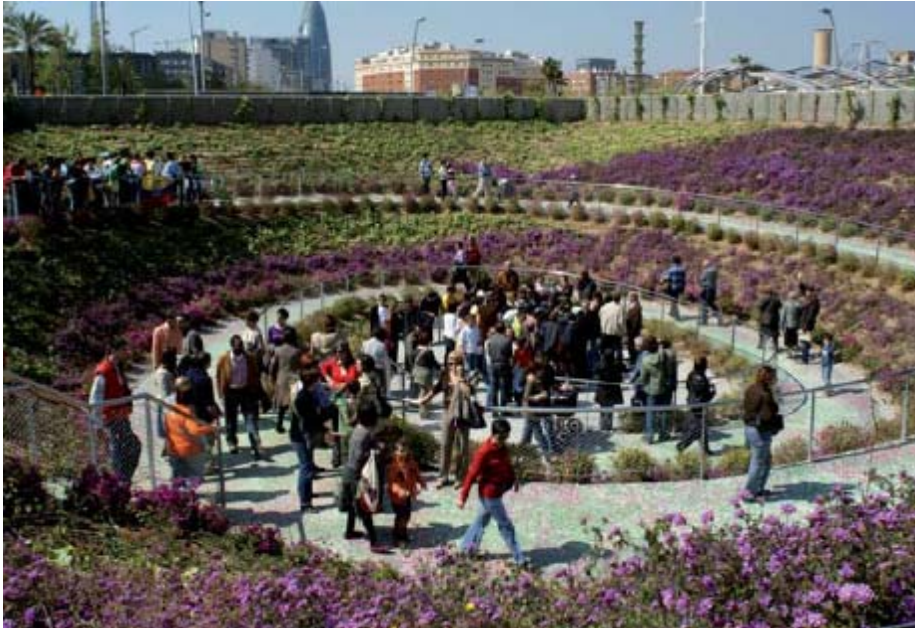
Slika 7.5: Prizorišče plesa Sardana, Parc del Poblenou.