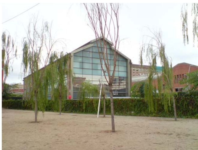
Slika 7.4 Parc Central del Poblenou.

Dvomimo v to, da bo kdaj uspel postati kaj več kot naključno mesto srečevanj. Konkurencu mu delajo zelene površine bližje plaži in Rambla del Poblenou.