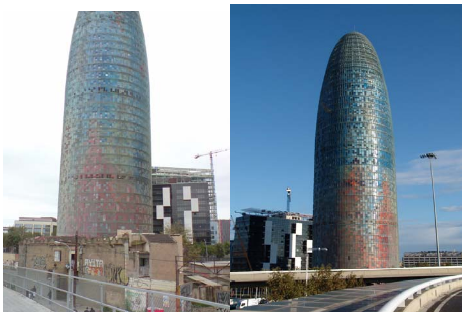
Slika 6.1: Torre Agbar, dve strani.