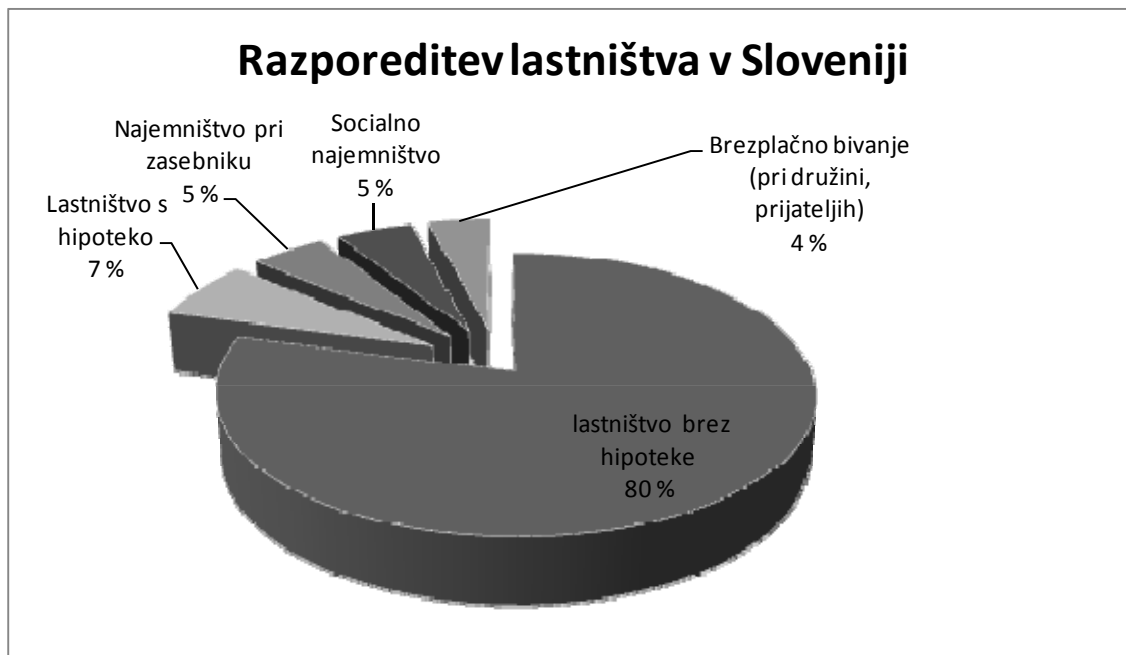
Grafikon 3.3: Razporeditev lastništva v Sloveniji