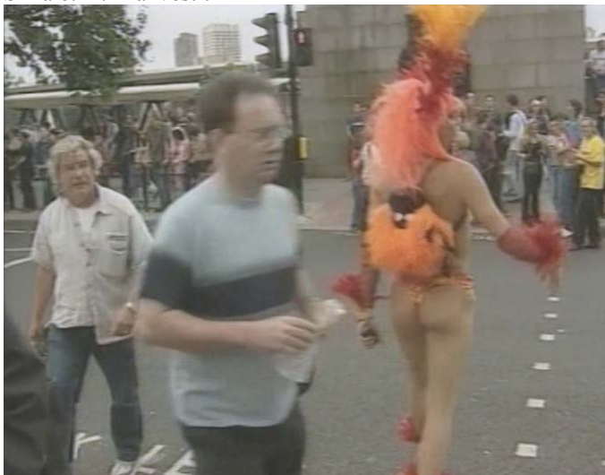
Slika 6.11: Tranvestit1