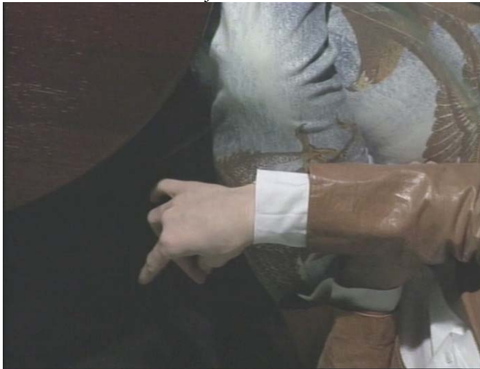
Slika 6.12: Feminilne kretnje

Stereotipizacija je prisotna predvsem v slikovni opremi, zelo malo v tekstu. Prikazuje označevalne stereotipe, kot so feminilne kretnje, urejenost, slaba poraščenost telesa in podobno. Kamera v teh primerih zelo približa del telesa. S pomočjo slikovnega materiala, ki sem ga predstavila v seksualizaciji, Televizija Slovenija krepi stereotip o promiskuitetnih homoseksualcih in stereotip, da so dobri plesalci.