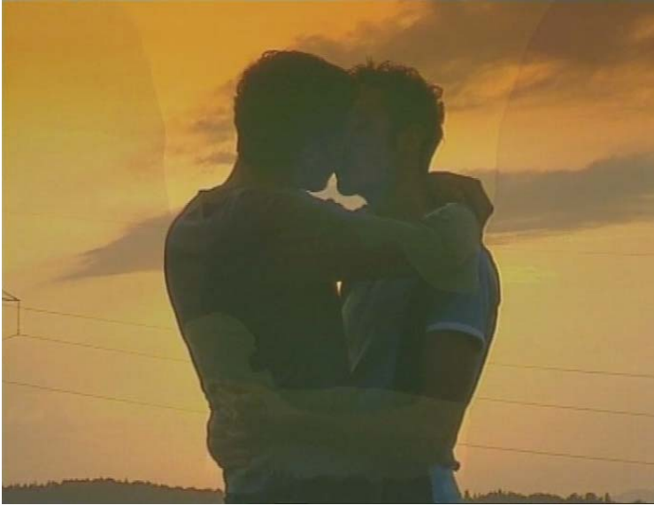
Slika 6.14: Zaljubljen par