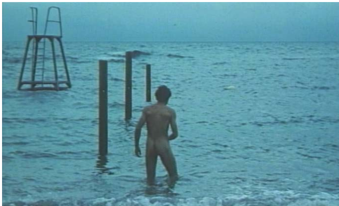
Slika 6.1: Golota