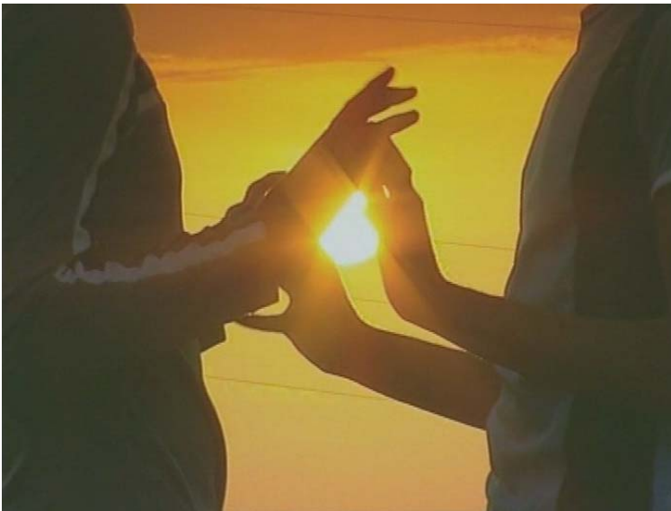
Slika 6.15: Romantika