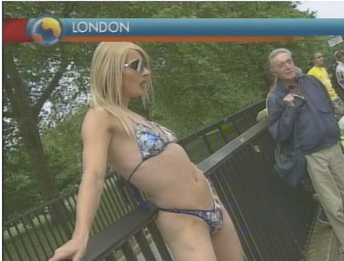
Slika 6.10: Tranvestit