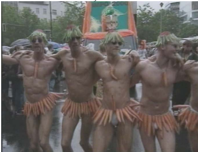
Slika 6.2: Goli moški s korenjem

Oglejmo si tri primere. Prispevek v Tedniku iz leta 2004 govori o vzrokih za zaplete pri sprejemanju Zakona o registraciji istospolne partnerske skupnosti. Pri tem oddaja posredno krivi Slovensko ljudsko stranko. Prispevek je politično obravnavan, slika pa prinaša drugačno reprezentacijo. Vse slike prikazujejo gole moške, ki na konotativni ravni vabijo k seksu, bodisi s korenjem, ki ima konotacijo penisa, erotičnim dotikanjem ali vulgarnim položajem jezika. Konotativna raven slikovne opreme je seksualizacija.