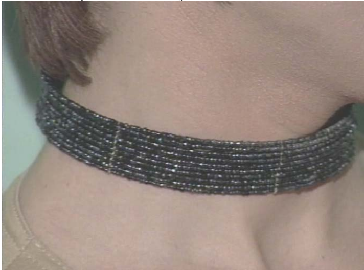
Slika 6.13: Neporaščenost in urejenost