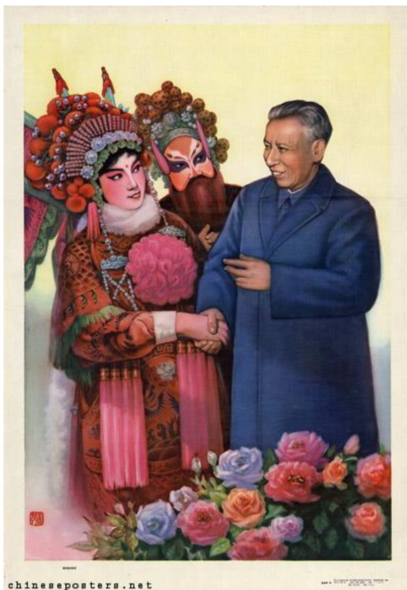
Avtor: Meng Yingsheng (孟英 声) Leto: julij 1981 Ljubeča oskrba Qinqiede guanghuai (亲切的关怀) Založnik : Sichuan renmin chubanshe (四川人民出版社)