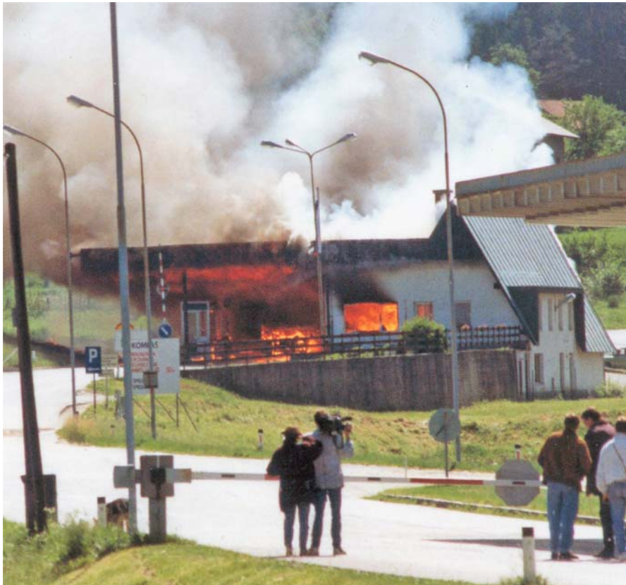
Slika 5.4: Mejni objekt v plamenih, 28.6.1991