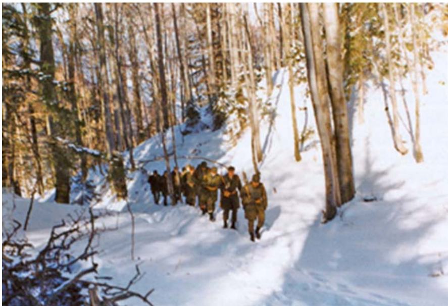
Slika 4.1: Urjenje alpskega izvidniškega voda

Teritorialna obramba je bila organizirana po občinah, občinski štabi pa podrejeni Pokrajinskemu štabu TO Zahodnoštajerske pokrajine (PŠTO ZŠP) Celje do leta 1980, ko je bil ustanovljen Pokrajinski štab za Teritorialno obrambo (PŠTO) Koroške s sedežem v Slovenj Gradcu.