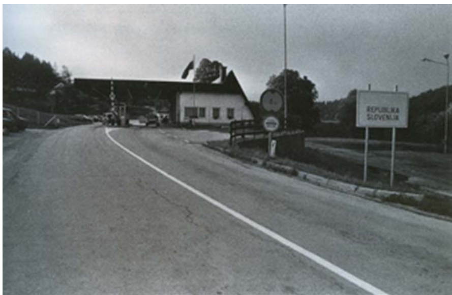
Slika 5.1: Mejni prehod Holmec po zamenjavi državnih simbolov, 27.6.1991